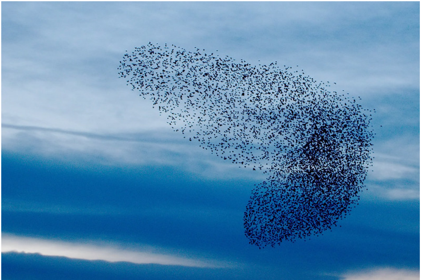
Afbeelding 2. Een zwerm spreeuwen. Het collectieve gedrag van spreeuwen is ook een complex systeem.