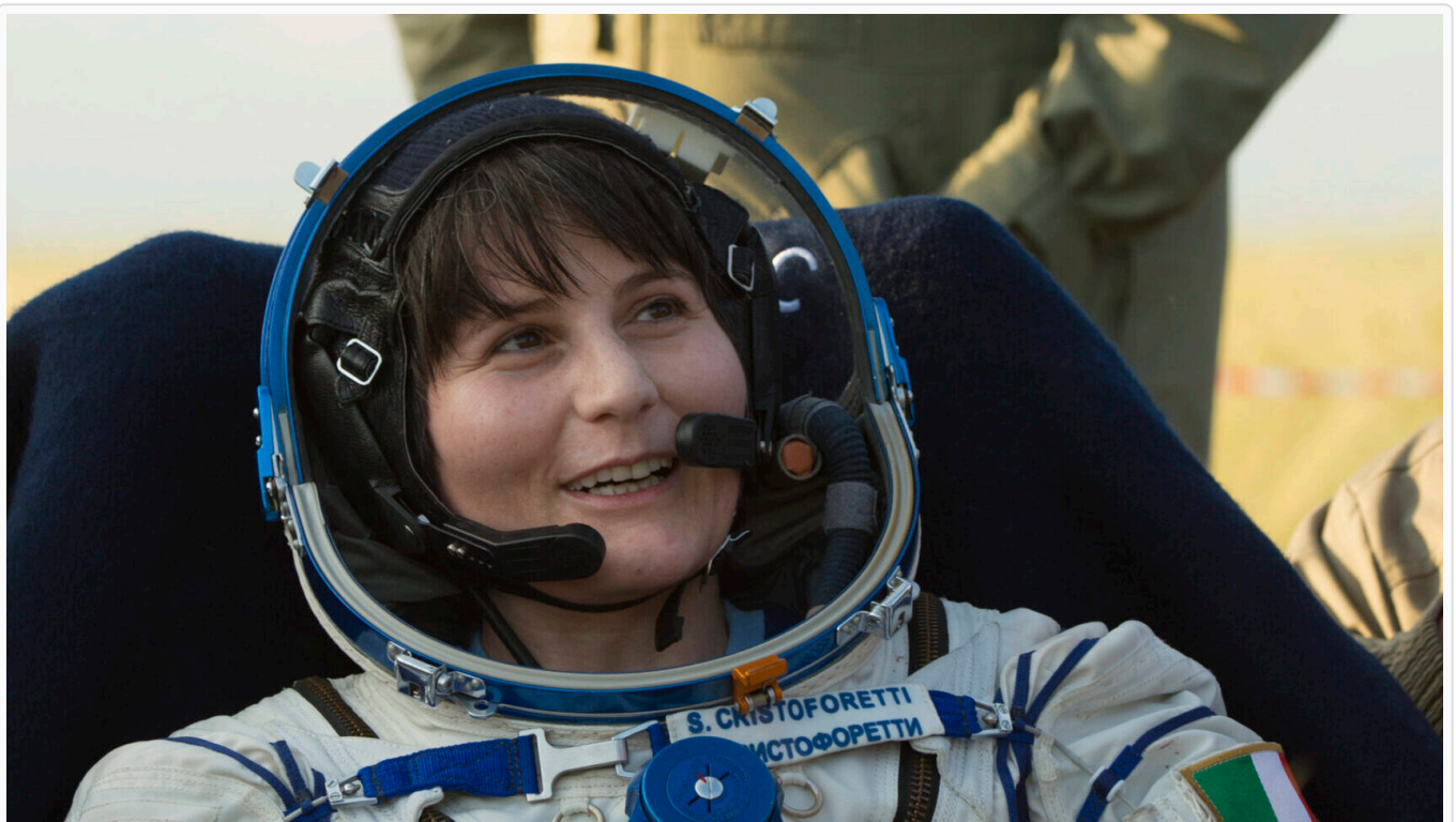
Afbeelding 1. ESA-astronaut Samantha Cristoforetti bij haar terugkeer op aarde.

Morgen opent de European Space Agency (ESA) voor het eerst in meer dan tien jaar een vacature voor astronauten. De gelukkigen zullen bijdragen aan missies naar het International Space Station, en misschien zelfs naar de maan of Mars afreizen. Maar wat doen die astronauten eigenlijk de hele dag als ze in de ruimte zijn?