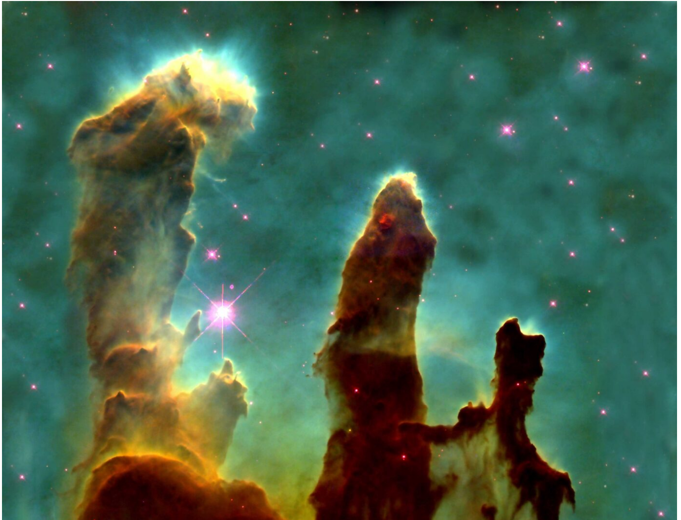
Afbeelding 3. Pillars of Creation.

Je kunt dit idee bijvoorbeeld gebruiken voor de elementen zuurstof, waterstof, en zwavel. Deze drie elementen komen voor in de Eagle Nebula, en hiervan is door Hubble een foto gemaakt. Het gebied op deze foto heet de 'Pillars of Creation'; het is misschien wel een van de bekendste foto's van de Hubble-telescoop. Maar deze foto is geen 'ware' kleurfoto die gemaakt is volgens de methode die ik hierboven besprak. Deze foto moet je zien als een soort van elementenkaart. Zwavel en waterstof worden van nature gezien in meer rood licht (waarbij waterstof iets meer oranje gekleurd is dan zwavel), en zuurstof is meer groen-blauw. Als we drie filters zouden gebruiken met precies deze kleuren, zou de foto er heel anders uit zien dan dat we hem kennen; de foto zou veel meer roodtinten bevatten, en bijna sepia-achtig zijn. Zeker niet minder mooi, maar de foto vertelt je op deze manier minder: zwavel en waterstof zijn niet goed van elkaar te onderscheiden. Om te zorgen dat dit wel kan wordt er met de kleuren van elementen geschoven: zuurstof heeft de kortste golflengte van de drie en