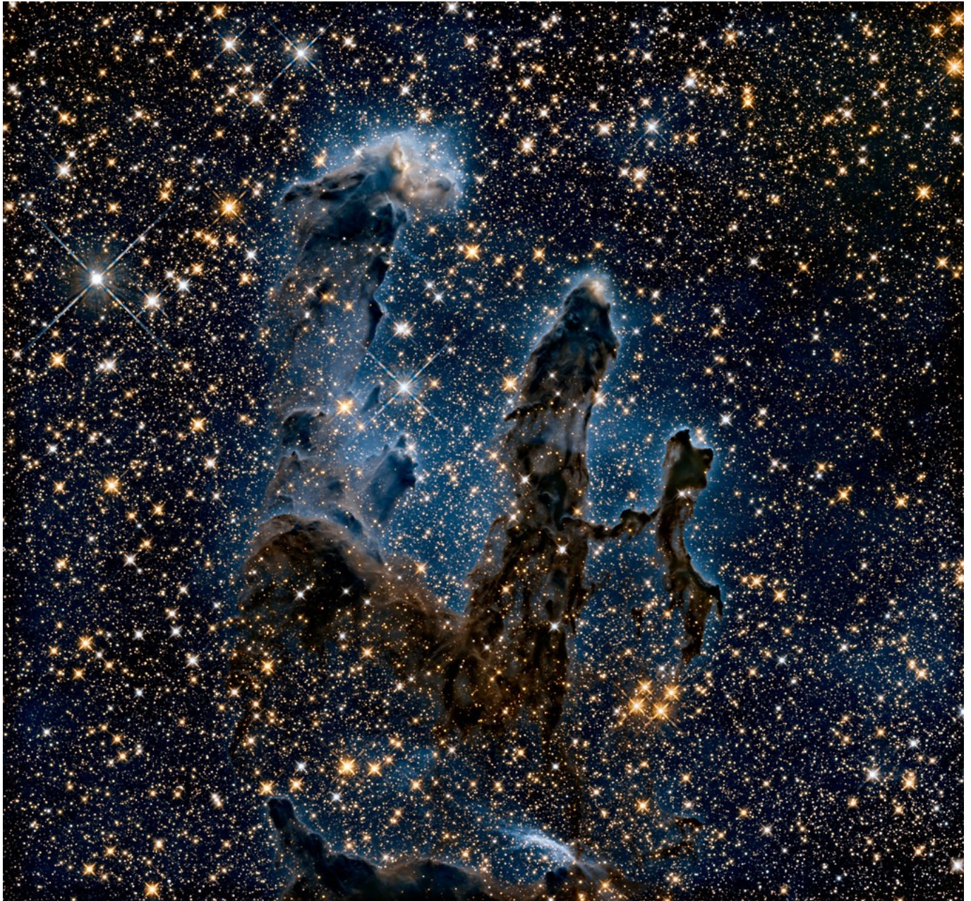
Afbeelding 4. Nogmaals de Pillars of Creation. In deze afbeelding is ook infrarood licht verwerkt.

Nu je weet hoe deze foto's worden ingekleurd, en dat er ook met kleuren wordt gespeeld, vraag je je misschien af of deze foto's dan wel 'echt' zijn. Het antwoord hierop is ja én nee: de kleuren in de foto's zijn niet 'bedacht' maar komen van echte data, en worden gebruikt om de compositie van bepaalde objecten te bestuderen. De 'valse' kleuren geven de bouwstenen weer waar deze nevels echt uit bestaan. Hierdoor kunnen we veel leren over hoe sterren of sterrenstelsels ontstaan en hoe de verschillende elementen interacties met elkaar aangaan. Nee, de foto's zien er dus niet uit zoals onze ogen de objecten zouden zien. Maar de kleuren zijn zeker niet willekeurig gekozen, alleen om het plaatje mooi te maken. Op deze