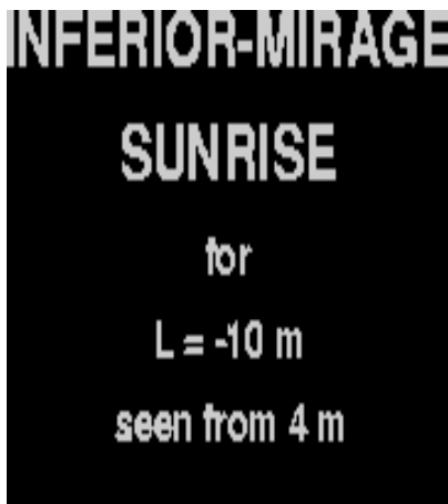
Afbeelding 3. Een groene flits door een mirage. Een simulatie van een zonsopgang met een “inferior mirage”: een extra afbeelding van de zon beneden de “primaire” zon. Vlak voordat de zon opkomt is een groene flits zichtbaar. Simulatie: Andrew T. Young .