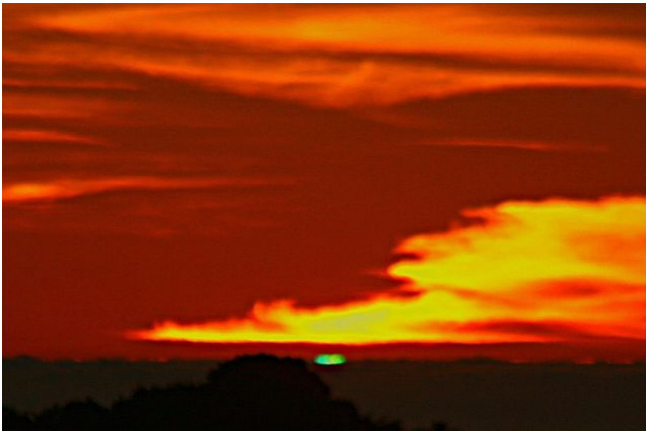
Afbeelding 1. Een groene flits.

De kerstvakantie is bij uitstek de tijd om binnen te blijven, de kachel aan te doen en een film te kijken. Deze vakantie besloot ik Pirates of the Caribbean te kijken. In een van de avonturen van de piraten zien ze gedurende een boottocht een groene flits vlak nadat de zon is ondergegaan, iets wat volgens oude piratenkennis zou betekenen dat een ziel terugkeert naar de wereld van de levenden. Wat is waar van deze piratenbakerpraat? Een duik in de natuurkunde achter de groene flits.