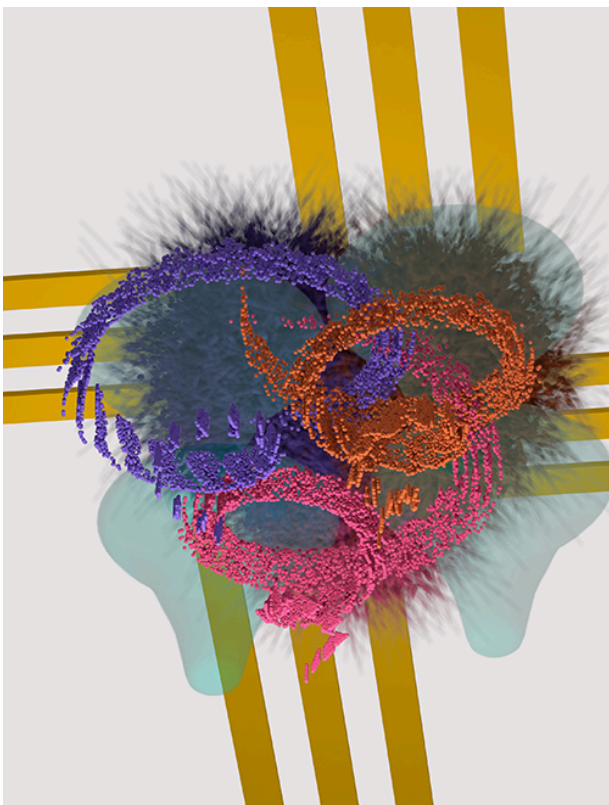
Afbeelding 1. Nagaoka-ferromagnetisme. Artistieke weergave van Nagaoka-ferromagnetisme op het 2x2-rooster