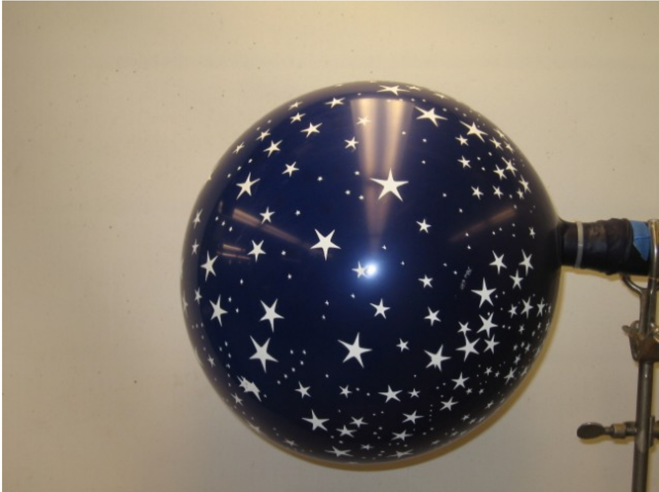
Afbeelding 2. Het heelal als ballon. Een huis-tuin-en-keukenversie van de kracht van De Sitter. Foto (en bijbehorend experiment): Universiteit van Michigan .

was hier zelf al niet heel comfortabel mee. Het was dus in zekere zin een opluchting toen Hubble ontdekte dat alle sterrenstelsels van ons weg bewegen, waardoor een oplossing van Einsteins vergelijkingen aannemelijker werd die deze donkere energie -pomp niet nodig heeft.