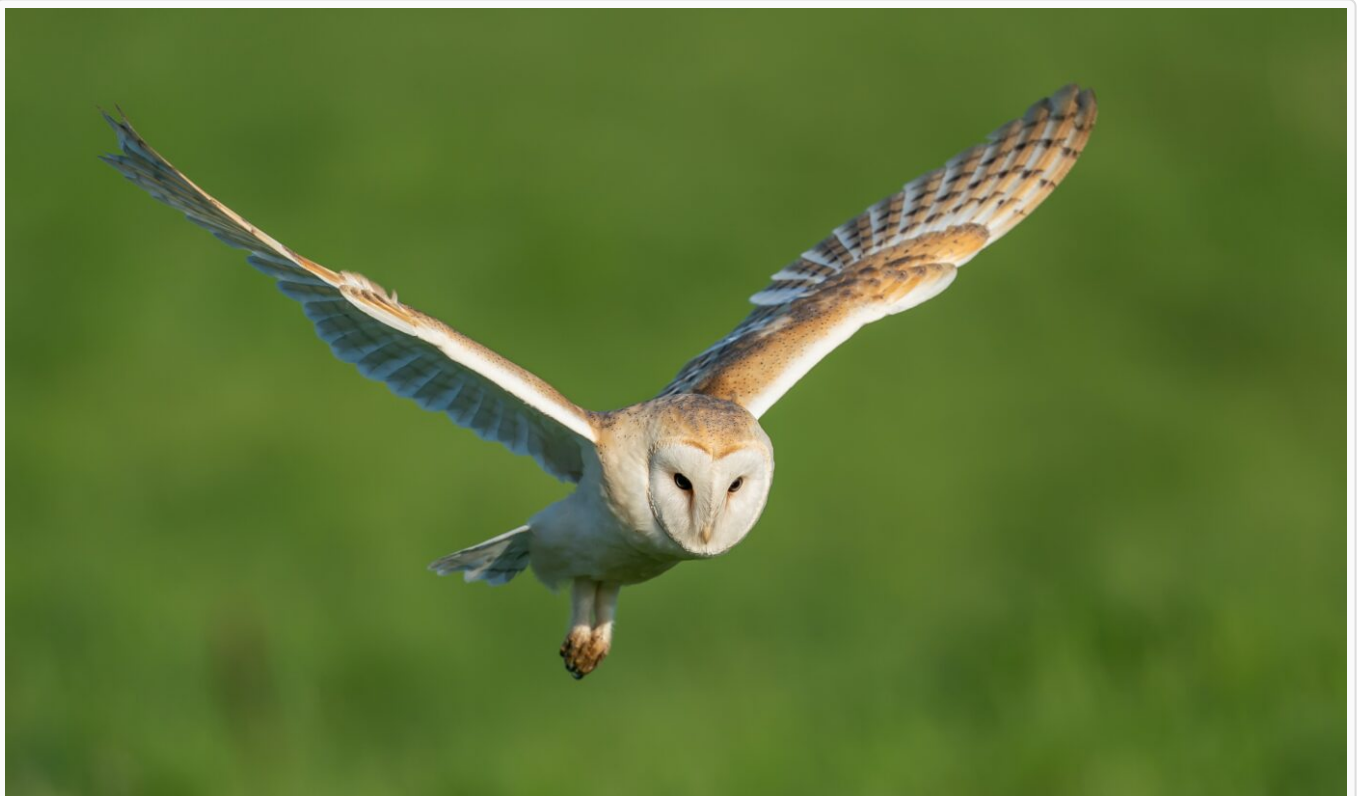
Afbeelding 1. Een kerkuil in vlucht. Afbeelding gemaakt door Bob Brewer .

Als we zouden weten hoe uilen zo stil kunnen vliegen, dan zou het mogelijk zijn om, door biomimicry toe te passen, onze uitvindingen te verbeteren en geluidsoverlast te verminderen.