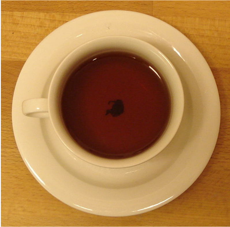
Afbeelding 1. Theebladjes in een theekopje.

Einstein realiseerde zich dat het theekopjesprobleem gerelateerd was aan de vraag waarom rivieren meanderen, en schreef daar een artikel over: “The Cause of the Formation of Meanders in the Courses of Rivers and of the So-Called Baer’s Law” . Het artikel bevat geen enkele vergelijking, en slechts drie plaatjes – en daarvan zijn er twee van een theekopje. Een benadering die kenmerkend is voor een natuurkundige die vooral op gedachte-experimenten bouwde. Laten we de redenering van Einstein eens nalopen.