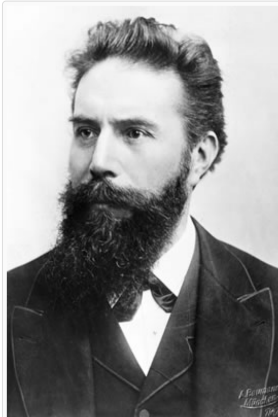
Afbeelding 2. Wilhelm Conrad Röntgen.

Om de aard van kathodestraling verder te onderzoeken maakte Röntgen gebruik van een vacuümbuis en een scherm dat bestond uit een stuk karton met daarop de fluorescerende stof bariumplatinocyanide. Vervolgens paste hij de opstelling zo aan dat er geen licht kon ontsnappen uit de vacuümbuis. Dit deed hij door de buis volledig te omhullen met karton. Wanneer hij in deze opstelling de buis aan zou zetten, zou er dus van buitenaf geen licht te zien moeten zijn.