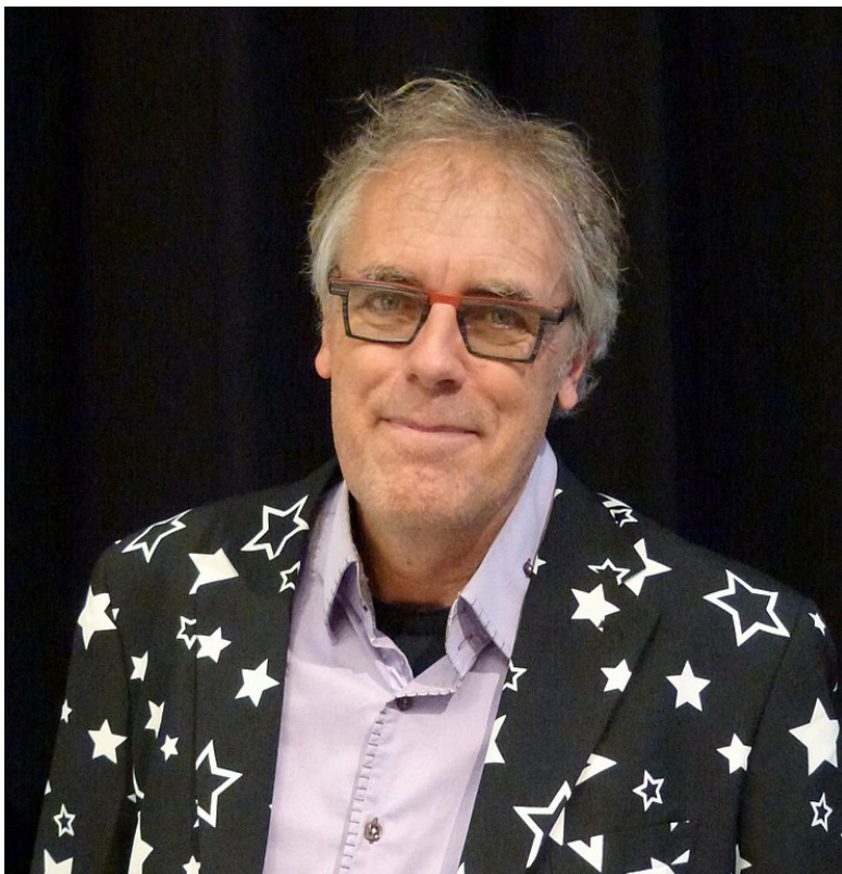
Afbeelding 2. Govert Schilling.

Niet alleen legt Schilling moeilijke zaken erg begrijpelijk uit, hij speelt ook kort op de bal. Na in 2012 een boek geschreven te hebben over het toenmalig erg actuele Higgsboson, brengt hij vijf jaar later opnieuw een erg relevant onderwerp kraakhelder aan de man. Het resultaat van dit project is het boek Deining in de Ruimtetijd , met als ondertitel Einstein, zwaartekrachtgolven en de toekomst van de astronomie .