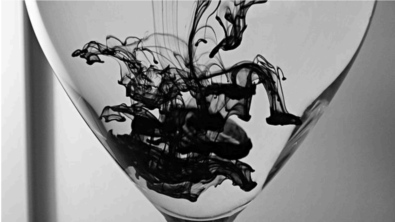
Afbeelding 1. Diffusie. Hoe snel verspreidt inkt zich in water?