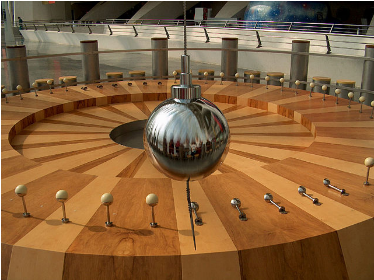
Afbeelding 3. De slinger van Foucault. Eén van de beroemdste typen slingers. Hoe lang de slingertijd is kun je, zonder ingewikkelde wiskunde, grotendeels bepalen met dimensie-analyse!