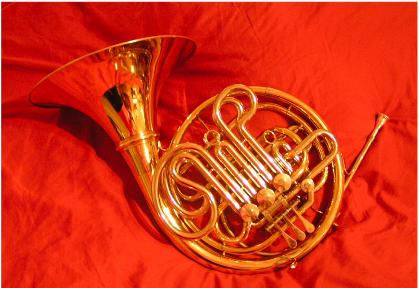
Afbeelding 1. Een hoorn. Zelfs een kapotte hoorn kan meerdere tonen voortbrengen!

Stel: je hebt een vriendin die een kapot instrument heeft - een hoorn, bijvoorbeeld. De hoorn is kapot in de zin dat je, wat je ook doet, maar één toon kan spelen. Nu stelt je vriendin je een weddenschap voor: "Wedden om een nieuwe hoorn dat ik je met mijn kapotte hoorn toch allerlei verschillende tonen kan laten horen?" Pas op: als je niet wilt verliezen kun je die weddenschap maar beter niet aannemen!