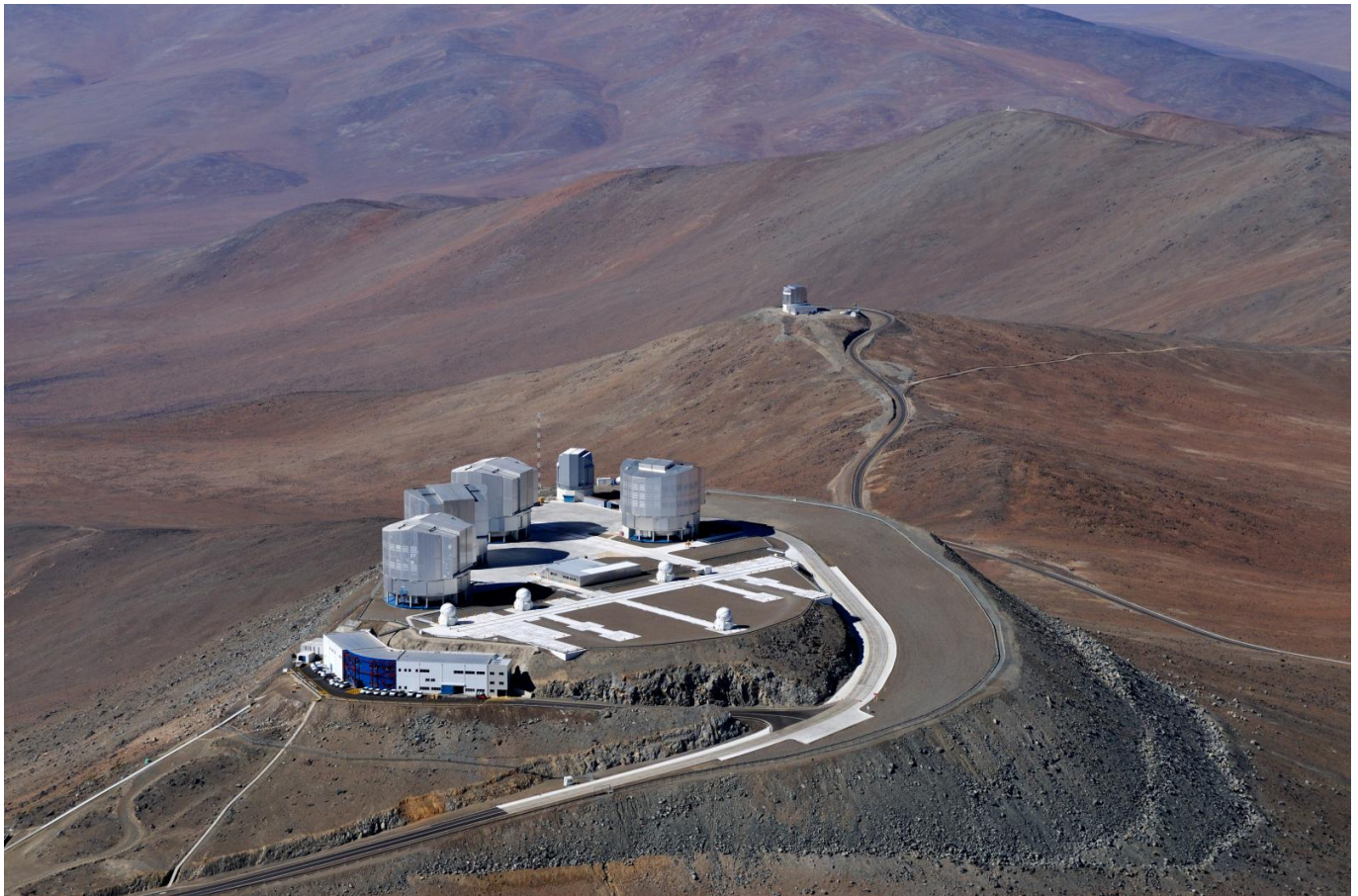
Afbeelding 2. Very Large Survey Telescope. Het Paranal-observatorium in Chili. De Very Large Survey Telescope, waarmee de verdeling van zwaartekracht is waargenomen, staat op de grote berg vooraan, net achter de vier telescopen van de Very Large Telescope.