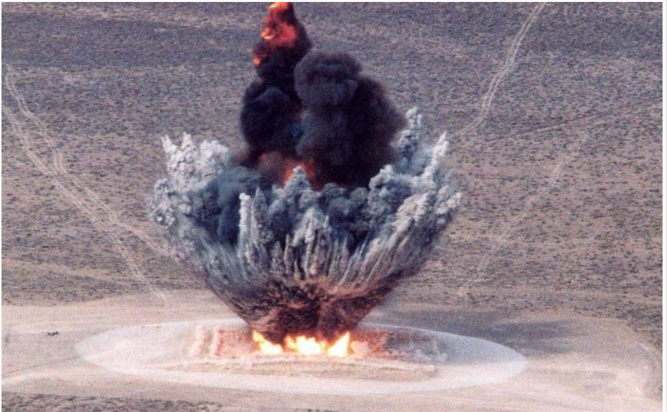
Afbeelding 2. Een explosie. Explosies zijn schoolvoorbeelden van instabiele natuurkundige systemen.