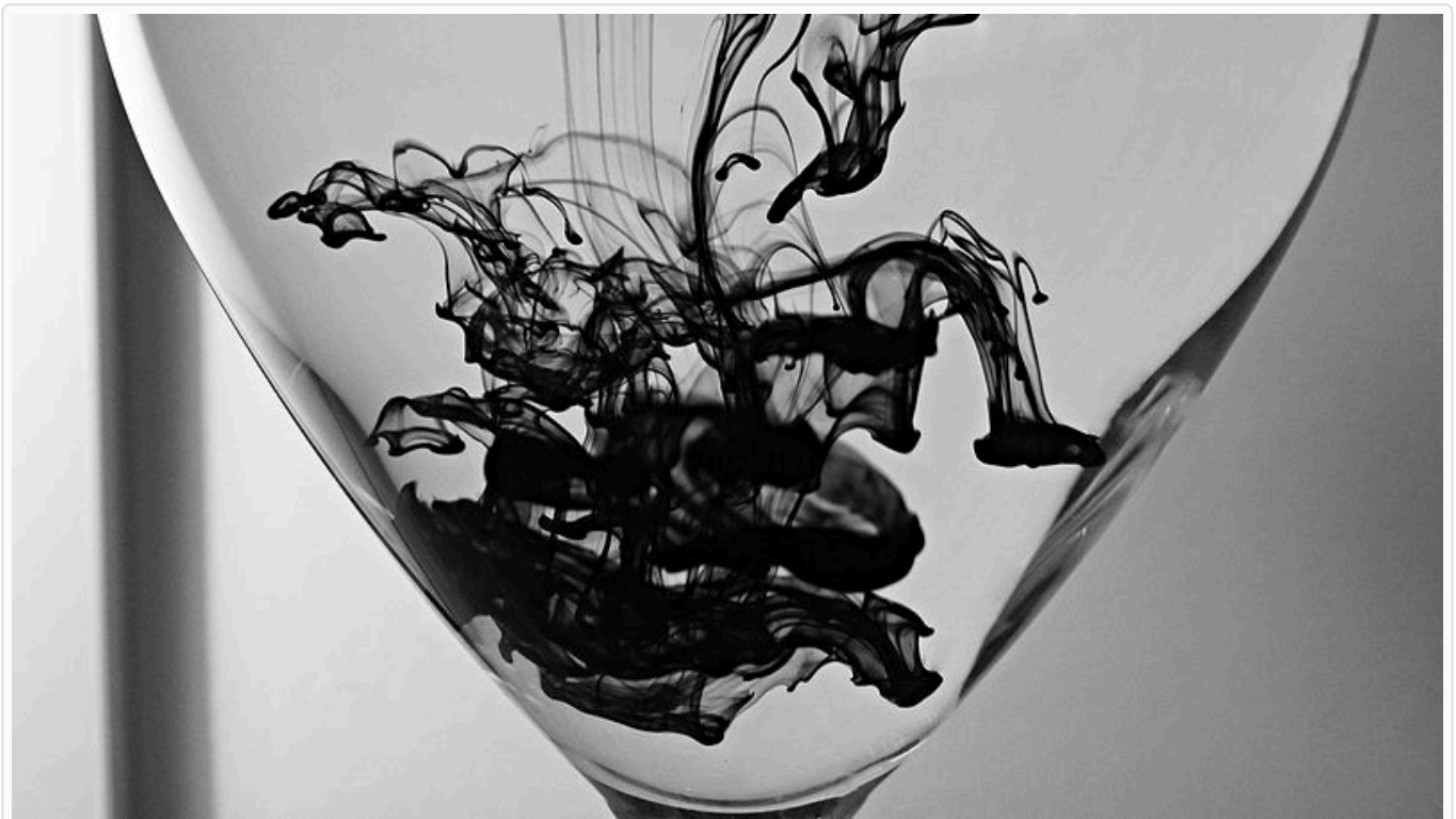
Afbeelding 1. Inkt in een glas water. Inkt verspreid zich in de loop van de tijd in water; waar een specifiek inktmolecuul eindigt hangt sterk af van de begincondities.

Natuurkunde doen betekent vaak: uit een bepaalde beginsituatie bepalen wat de eindsituatie zal zijn. Wiskundiger gezegd lossen we als natuurkundigen ‘bewegingsvergelijkingen’ op, en de vorm van de oplossing hangt af van de gekozen begincondities. Maar... in de wereld van de begincondities is niet elke keuze gelijk!