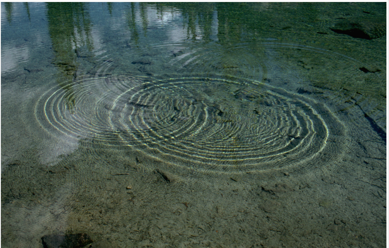
Afbeelding 2. Interferentie. Ook watergolven vertonen interferentie: als je bij elkaar komen, zie je op sommige plekken extra hoge pieken ontstaan, en op andere plekken blijft het water vrijwel vlak. Het gevolg: het ruitjespatroon dat je ziet waar de golven bij

Je zou natuurlijk kunnen zeggen – en dat deed Einstein oorspronkelijk ook – dat de beschrijving in termen van golven helemaal niet nodig is. Misschien kan een deeltje, als je maar goed genoeg kijkt, helemaal niet op meerdere plaatsen tegelijk zijn. Misschien weten we alleen op een bepaald moment niet precies waar het is, en beschrijft de quantummechanica die onwetendheid in termen van een ‘kansgolf’. Een makkelijke weg uit dit probleem, zo lijkt het, maar uiteindelijk blijkt dat die oplossing nooit het hele verhaal kan zijn! Je kunt namelijk experimenten doen waarbij de uitkomst bepaald wordt door het feit dat een deeltje vóórdat je het waarneemt daadwerkelijk op verschillende plaatsen tegelijk is.