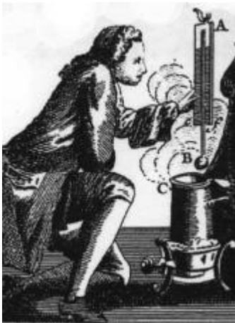
Afbeelding 2. Fahrenheit. Daniel Gabriel Fahrenheit (1686-1736) ikt een van zijn thermometers.

Daniel Gabriel Fahrenheit kwam op de wereld op 24 mei 1686 in Danzig (tegenwoordig Gdansk) en overleed op 16 september 1736 in Den Haag. Er is maar weinig bekend over de wijze waarop Fahrenheit zijn thermometers produceerde. Wel is bekend hoe hij zijn schaal kalibreerde, namelijk door middel van drie ijkpunten. Wanneer je ijs, water en een zout als salmiak of zeezout mengt, kun je kunstmatig zeer lage temperaturen verkrijgen. Fahrenheit ontdekte dit per toeval doordat hij wat van deze stoffen op de trap morste en daar terstond ijssterretjes zag ontstaan. Dit mengsel krijgt een temperatuur van ongeveer -16 graden Celcius.