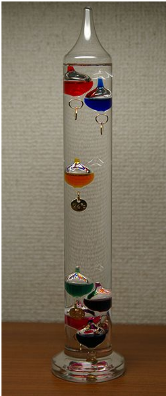
Afbeelding 1. Een thermometer. De thermometer met zwevende vloeistofbellen is een van de oudste soorten gesloten thermometers.

We voelen dat een kop thee warmer is dan een (levende) kat, en dat een kat op zijn beurt weer warmer is dan een sneeuwbal. Er zou een temperatuurschaal kunnen worden gemaakt van koud, warm en heet. Maar is dat wel handig? Wat gebeurt er dan als de kop thee afkoelt? Wanneer gaat deze van heet naar warm? Of moet er in de temperatuurschaal ook een “beetje heet” worden geïntroduceerd?