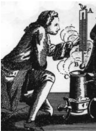
Afbeelding 2. Fahrenheit. Daniel Gabriel Fahrenheit (1686-1736) ijkte een van zijn thermometers.

Daniel Gabriel Fahrenheit kwam op de wereld op 24 mei 1686 in Danzig (tegenwoordig Gdansk) en overleed op 16 september 1736 in Den Haag. Er is maar weinig bekend over de wijze waarop Fahrenheit zijn thermometers produceerde. Wel is bekend hoe hij zijn schaal kalibreerde, namelijk door middel van drie ijkpunten. Wanneer je ijs, water en een zout als salmiak of zeezout mengt, kun je kunstmatig zeer lage temperaturen verkrijgen. Fahrenheit ontdekte dit per toeval doordat hij wat van deze stoffen op de trap morste en daar terstond ijssterretjes zag ontstaan. Dit mengsel krijgt een temperatuur van ongeveer -16 graden Celcius.