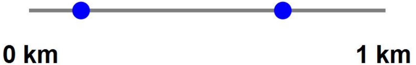
Afbeelding 2. Twee auto's op een weg

Een nadeel van deze weergave is dat we de twee auto's nu niet van elkaar kunnen onderscheiden. Als we de auto's van plaats verwisselen ziet het diagram er precies hetzelfde uit. We kunnen dit natuurlijk oplossen door de stippen verschillende kleuren te geven, of te nummeren, maar er is een elegantere oplossing: we kunnen de posities van elke auto op een afzonderlijke lijn weergeven – zie afbeelding 3. De situatie waarin we de twee auto's van plaats verwisselen is nu duidelijk te onderscheiden van de oorspronkelijke situatie, omdat elke auto zijn “eigen lijn” heeft.