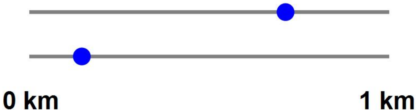
Afbeelding 3. Weergave op twee lijnenDe auto's rijden op dezelfde weg, maar we geven de positie van elke auto aan op een afzonderlijke lijn.

Een nadeel van deze weergave is dat we de twee auto's nu niet van elkaar kunnen onderscheiden. Als we de auto's van plaats verwisselen ziet het diagram er precies hetzelfde uit. We kunnen dit natuurlijk oplossen door de stippen verschillende kleuren te geven, of te nummeren, maar er is een elegantere oplossing: we kunnen de posities van elke auto op een afzonderlijke lijn weergeven – zie afbeelding 3. De situatie waarin we de twee auto's van plaats verwisselen is nu duidelijk te onderscheiden van de oorspronkelijke situatie, omdat elke auto zijn “eigen lijn” heeft.