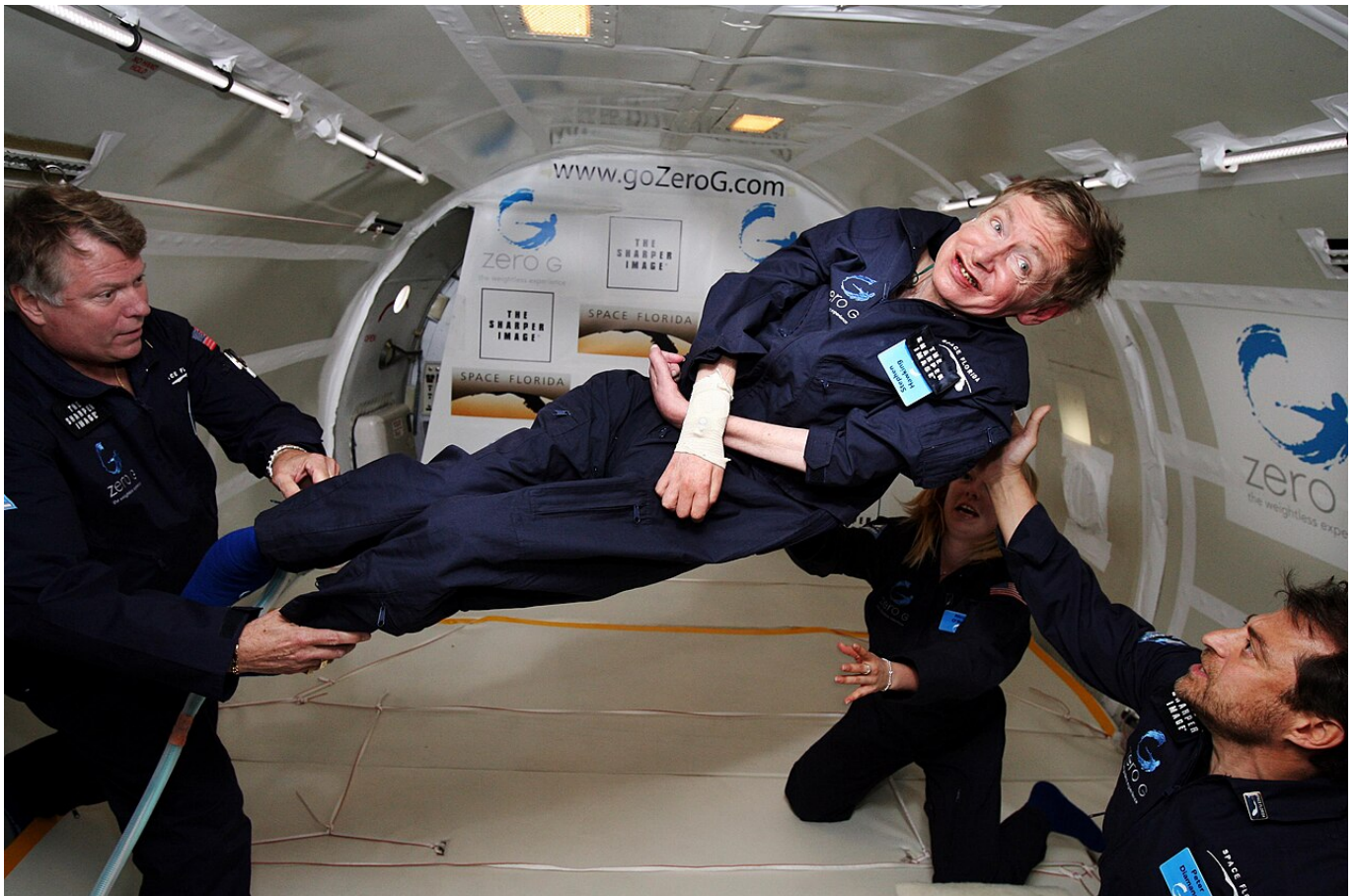
Afbeelding 3. Stephen Hawking in vrije val.

entropie. Dat blijkt inderdaad zo te zijn, ten minste: als het licht wat je in het zwarte gat schijnt een golflengte heeft die korter is dan grofweg de grootte van het zwarte gat zelf. Voor licht met een langere golflengte gaf Bekenstein ook een, wat omslachtig en uiteindelijk niet kloppend, argument, maar we zullen hierna zien dat je eigenlijk precies zo'n afwijking zou verwachten.