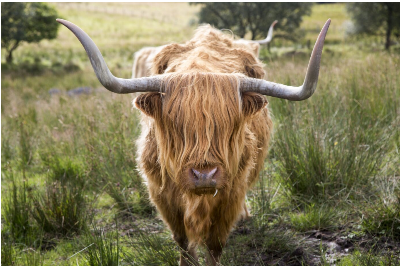
Afbeelding 1. Een Schotse Hooglander - oftewel: een harige koe.

In de natuurkunde verzinnen we soms, of, laten we eerlijk zijn: best wel vaak, rare namen voor de dingen die we willen beschrijven. Zo is het bijvoorbeeld niet ongebruikelijk om bij een lezing over harige zwarte gaten te horen. We hebben het zelfs soms over zachte haren van zwarte gaten. Je begint je misschien af te vragen waar men het dan in hemelsnaam over heeft. Deze woorden hebben echter een heel andere betekenis dan de gebruikelijke, wanneer het zwarte gaten betreft.