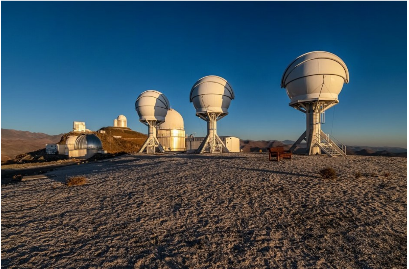
Afbeelding 1. BlackGEM. Een foto van de BlackGEM-array in Chili.

In 2015 werd experimenteel bevestigd wat veel natuurkundigen al langer vermoedden, en werd Einsteins voorspelling realiteit: de eerste meting van zwaartekrachtsgolven was een feit! Volgens de algemene relativiteitstheorie leven we in een vervormbare ruimtetijd. Rimpelingen in die ruimtetijd, als gevolg van extreme sterrenkundige gebeurtenissen, heten zwaartekrachtsgolven. Die golven zijn heel moeilijk te meten, omdat het signaal heel zwak is – één deel in (10^{20}) . Volgens Einstein was dit effect dan ook veel te klein om ooit waar te kunnen nemen.