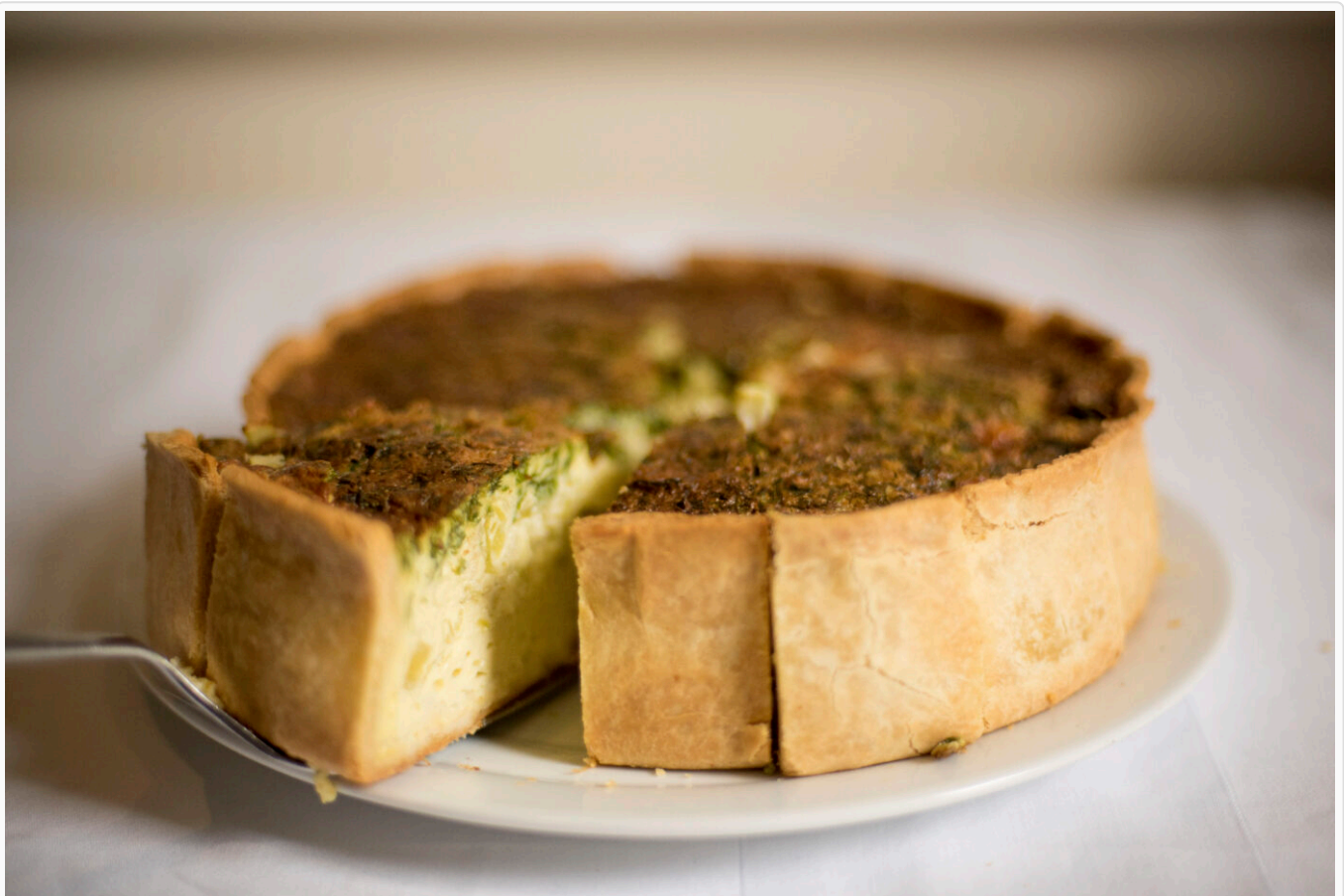
Afbeelding 1. Fractonen. Zoals een taart uit fracties kan bestaan, zo kan een deeltje dat ook. Foto via Stocksnap .

Protonen, elektronen, fotonen – natuurkundigen geven de bouwstenen van ons heelal graag namen die op -onen eindigen. Het is dan ook niet verbazend dat fracties van deeltjes ‘fractonen’ worden genoemd. Maar wat is een fracton nu precies, en wat hebben we eraan? Nieuwe QU-redacteur Boris Post legt het uit.