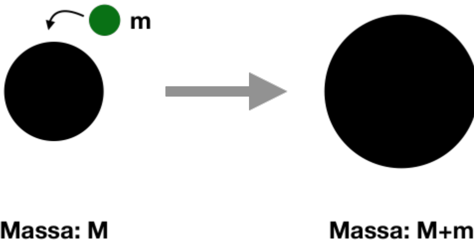
Afbeelding 2. Een groeiend zwart gat. Een zwart gat wordt groter wanneer we er meer energie (materie) in stoppen.

Een bijkomend effect van dit verband is dat het meestal mogelijk is om alledaagse natuurkundige fenomenen te verklaren zonder dat we ons druk hoeven te maken om de microscopische wereld. Verrassend genoeg werkt deze logica echter niet altijd. Stel je eens een zwart gat voor. De straal van het zwarte gat – en daarmee zijn karakteristieke lengteschaal – is evenredig met zijn massa. Als we meer energie (materie) in het zwarte gat stoppen, wordt het dus groter – zie afbeelding 2. Ondanks dat het zwarte gat nu een hogere energie heeft, is zijn karakteristieke lengteschaal ook groter geworden! Dit suggereert dat de het zwarte gat de natuurkunde van hoge energieën (die normaal gesproken horen bij een kleine afstand) mengt met de natuurkunde van lage energieën (die overeenkomen met de massa bij een kleine straal).