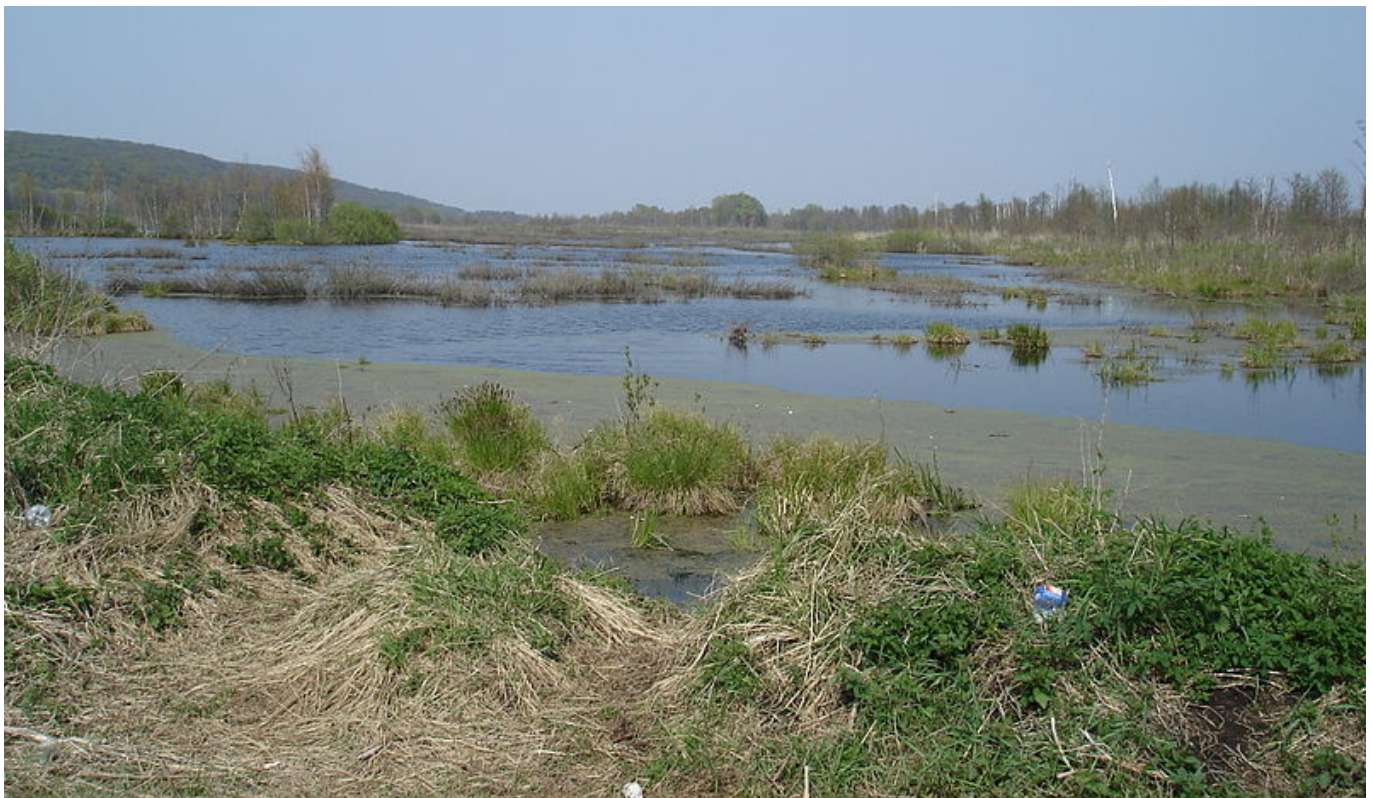
Afbeelding 1. Een moerasland. Vormt het “landschap” van quantumzwaartekracht-theorieën deels een “moerasland”?

Meestal trekken natuurkundige fenomenen die zich afspelen op grote lengteschalen zich niks aan van de natuurkunde op veel kleinere schalen. Om bijvoorbeeld het overstromen van een flesje bier te begrijpen, of om te verklaren waarom de lucht blauw is , is kennis over de subatomaire wereld niet nodig. En gelukkig maar! Als dit niet zo was zou elk klein microscopisch effect een gigantisch gevolg kunnen hebben voor de macroscopische wereld. Recent onderzoek suggereert echter dat deze “ontkoppeling van lengteschalen” niet altijd gebeurt, en dat de fysica op de allerkleinste schalen soms ook grote gevolgen kan hebben!