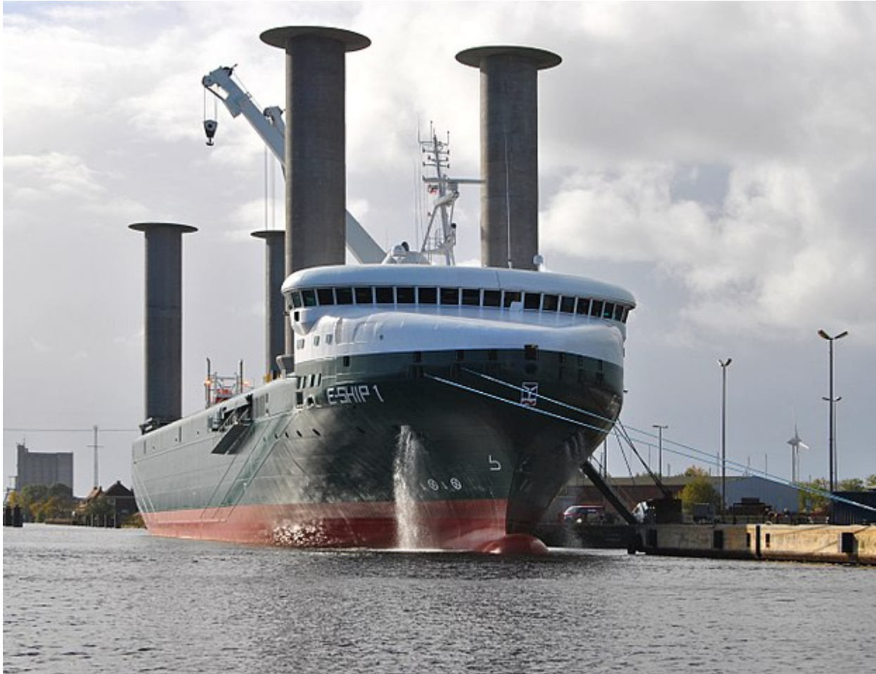
Afbeelding 2. Een rotorschip. Een schip met een zogenaamde Anton Flettnerrotor: de draaiende cilinders veroorzaken een magnuskracht die de boot voortstuwt.

Al met al is het magnuseffect dus een erg alledaags fenomeen, maar toch een dat onwaarschijnlijke technische toepassingen heeft, en magische sportmomenten kan opleveren. Nu weet je de verrassende oorsprong!