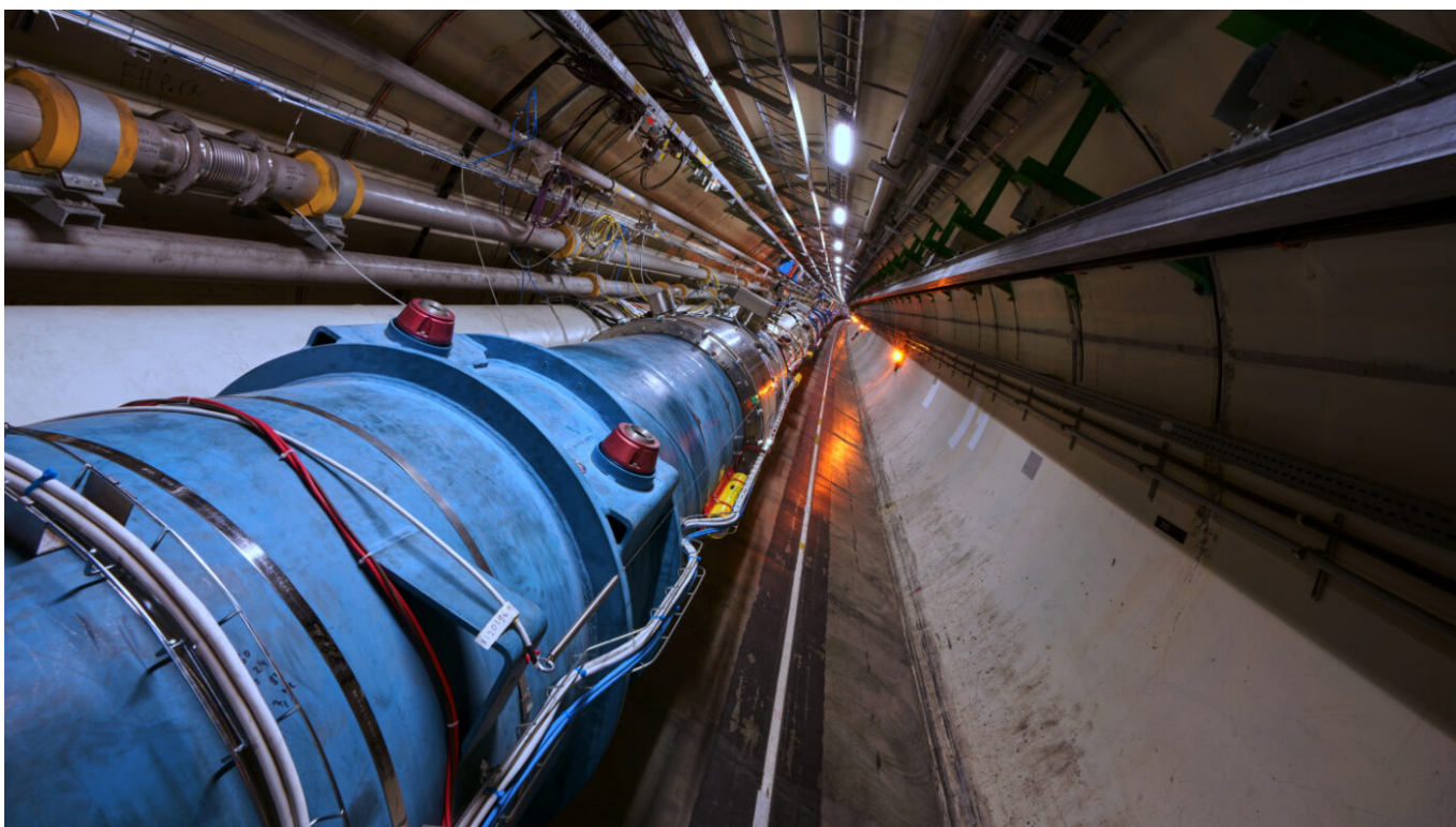
Afbeelding 1. De Large Hadron Collider. Met deze deeltjesversneller – in totaal 27 kilometer lang – en toekomstige nóg grotere versnellers onderzoeken natuurkundigen de eigenschappen van het standaardmodel. Foto: CERN.