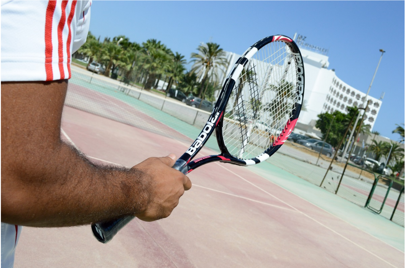
Afbeelding 3. Een tennisracket. Probeer het zelf: rond welke as kun je een tennisracket wel en niet gemakkelijk laten draaien?

De reden dat juist de tweede as een instabiele draaiing heeft, is dat deze as ook het middelste traagheidsmoment heeft. Het traagheidsmoment van een voorwerp met betrekking tot een bepaalde draai-as is een grootte die uitdrukt hoe makkelijk of moeilijk het is om het voorwerp te laten draaien rondom die as. Je kunt je misschien voorstellen dat draaien rondom as e_1 het gemakkelijkst gaat (as e_1 heeft het kleinste traagheidsmoment) omdat het tennisracket het smalst is rondom die richting. As e_3 is juist het moeilijkst om het racket om rond te draaien - deze as heeft dus het grootste traagheidsmoment - en de tweede as zit daar tussenin.