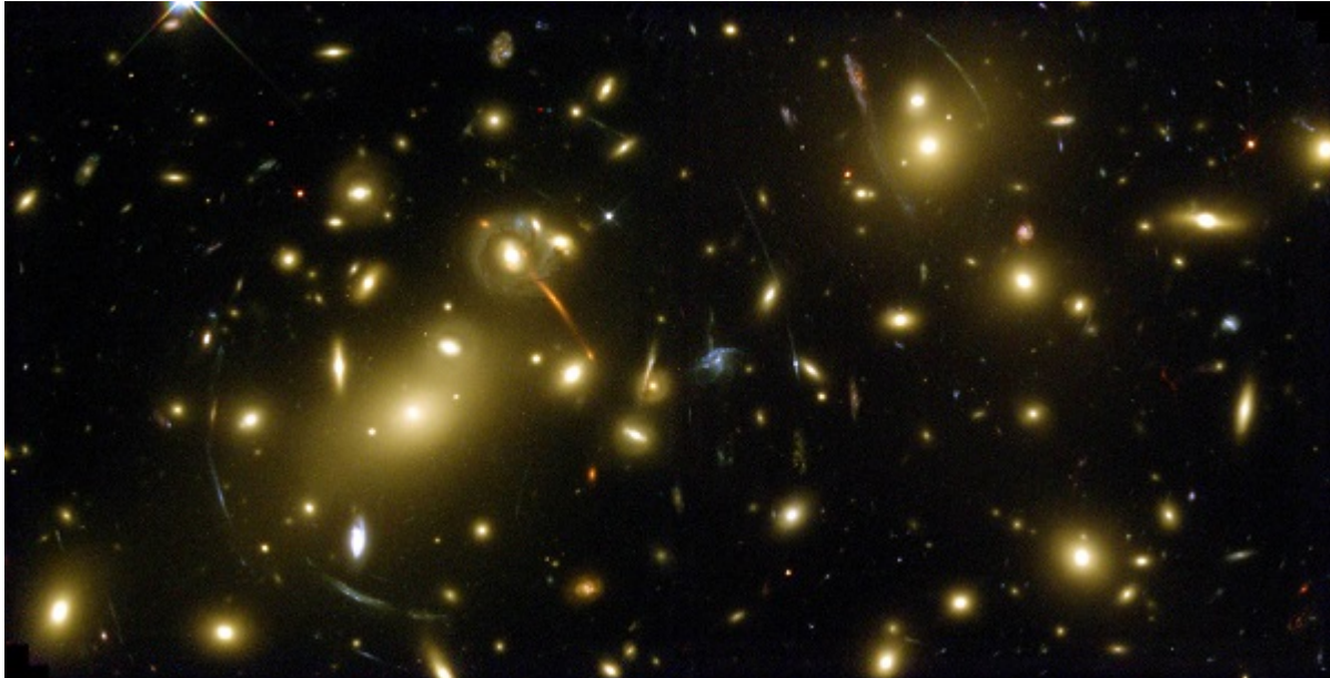
Afbeelding 1. Abell 2218. Abell 2218 is een van de vele groepen van sterrenstelsels die we aan de hemel zien. Op gigantische afstanden bezien zijn deze sterrenstelsels de 'atomen' waaruit het heelal is opgebouwd.

Is het golfverschijnsel zelfs zo universeel dat die enorme hoeveelheid sterren, het heelal, ook kan golven? Leuk genoeg is het antwoord: ja! Althans, echt golven doet het niet. Het blijkt zich meer te gedragen als 'stroperige' vloeistoffen zoals gesmolten chocolade, vla, of ketchup, dan als golvend water. Om te weten hoe de verdeling van massa in het heelal op de grootste schalen, flink uitgezoomd, zich gedraagt – iets wat essentieel is om uiteindelijk iets over het ontstaan van het heelal te leren – hoeven we dus alleen maar de vergelijkingen die gesmolten chocolade beschrijven te kennen!