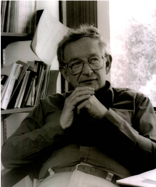
Afbeelding 2. Philip W. Anderson. Philip Warren Anderson (1923) won in 1977 de Nobelprijs voor de natuurkunde.

Nu blijkt in praktijk dat dit laatstgenoemde nagenoeg onmogelijk is. Laten we dit illustreren met de volgende metafoor.