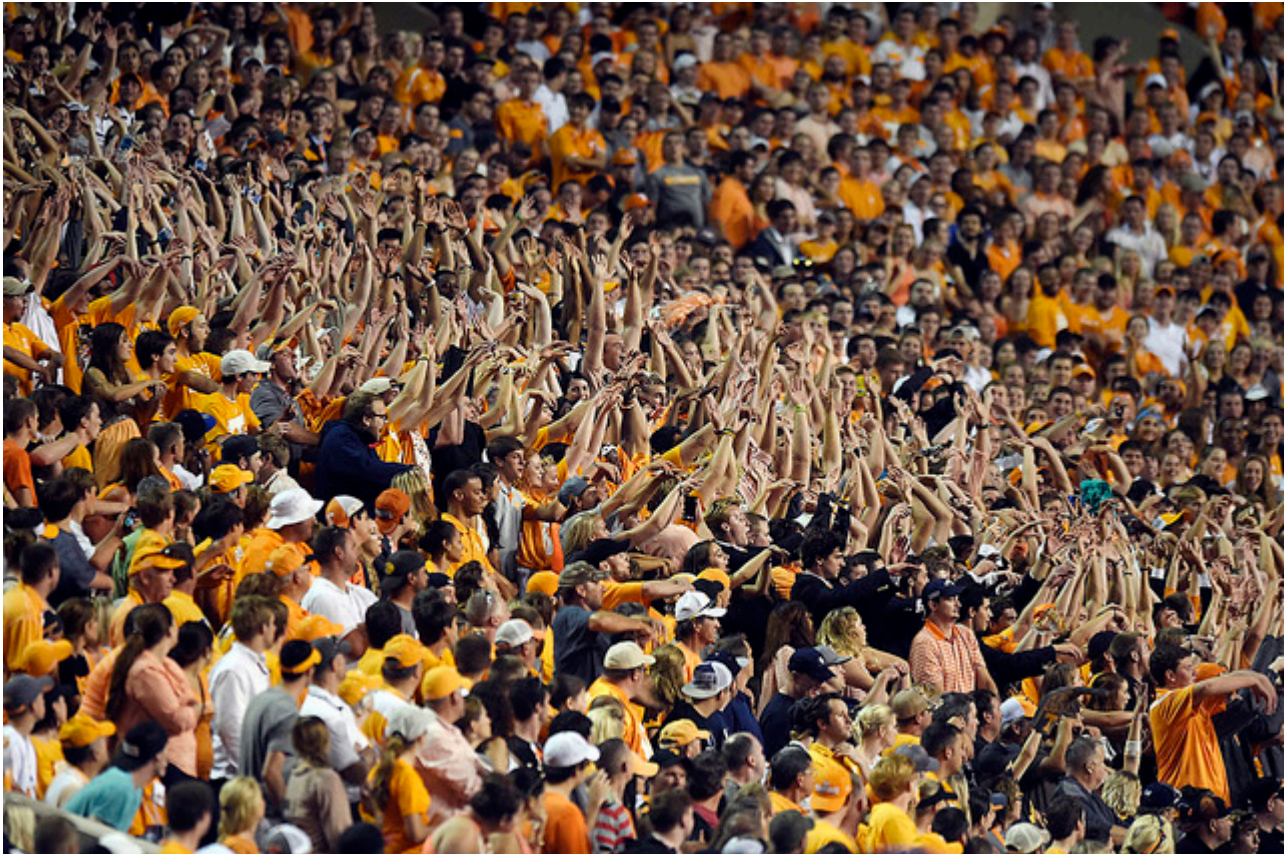
Afbeelding 3. Een wave in een voetbalstadion. Een wave zoals deze is een grootschalig effect, dat op het niveau van de individuele supporters erg lastig te beschrijven is.

Daar waar de hoge-energiefysicus zich midden in het stadion bevindt, en alle details goed in de gaten houdt, zien we de lage-energiefysicus zitten bovenin de skybox waar zij een goed overzicht heeft over het gehele stadion. Gezien vanuit haar ogen, is het veel efficiënter om het systeem te beschrijven in termen van de ontstane golven, die elk beschreven kunnen worden met slechts een paar parameters (snelheid, positie op een gegeven vast tijdstip, etc.), in tegenstelling tot de gigantische hoeveelheid data die nodig is om alle posities van alle supporters die deel uitmaken van de wave in de loop van de tijd bij te houden.