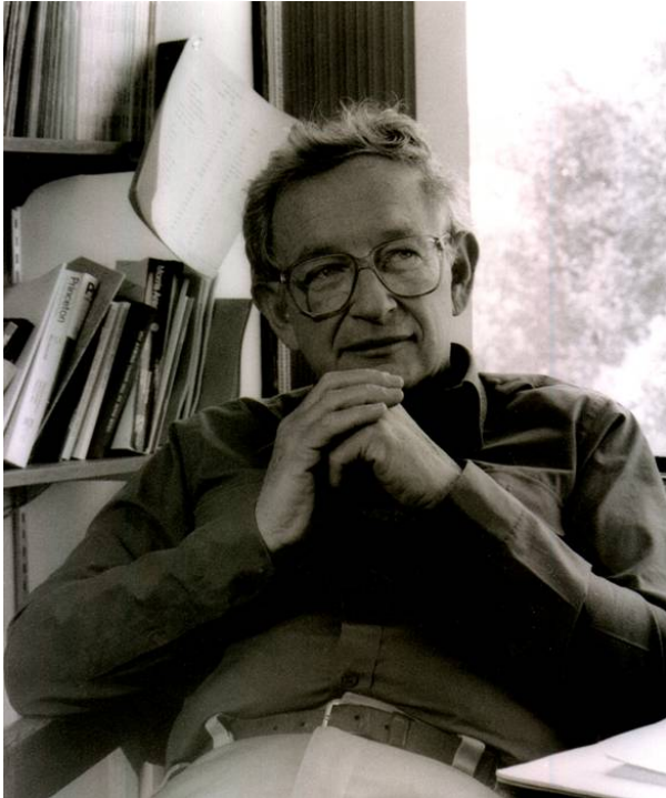
Afbeelding 2. Philip W. Anderson. Philip Warren Anderson (1923) won in 1977 de Nobelprijs voor de natuurkunde.

Nu blijkt in praktijk dat dit laatstgenoemde nagenoeg onmogelijk is. Laten we dit illustreren met de volgende metafoer.