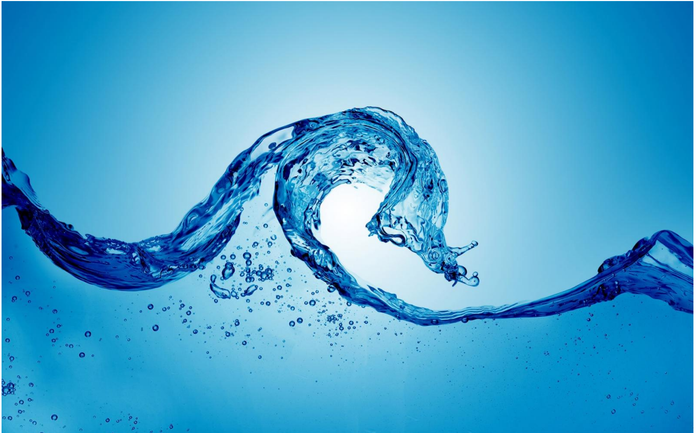
Afbeelding 4. Een watergolf. Een bak water bevat al snel 10^{23} watermoleculen. Hier is het gebruik van emergente beschrijvingen dus nog veel belangrijker dan in het voorbeeld van het voetbalstadion. (Bron.)

Terug naar de hoofdvraag. Stel nu dat we een theorie van alles in handen hebben. Weten we dan alles wat er te weten valt? Philip W. Anderson beweerde van niet, omdat voor het beantwoorden van praktische vragen in bijna alle gevallen een bijbehorende emergente theorie nodig is. Het bedenken van de juiste emergente theorie is echter een vak apart, precies omdat deze emergente theorie op het eerste gezicht heel verschillend kan zijn van de onderliggende fundamentele theorie. We mogen hieruit concluderen dat elke natuurwetenschap op zijn eigen manier fundamenteel is. En als we ooit al zo gelukkig zijn om een theorie van alles ontdekken, dan is dat niet het einde van de wetenschap, maar pas het begin.