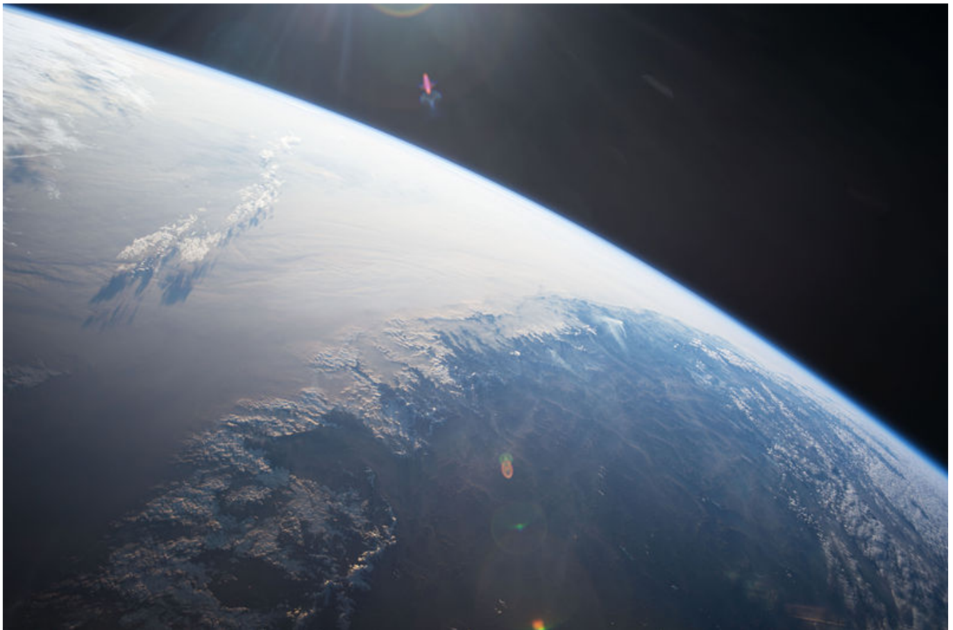
Afbeelding 1. Voor astronauten is het duidelijk: de aarde is rond.

Hoe kunnen we zeker weten dat de aarde rond is? Voor velen is deze foto, gemaakt vanuit het International Space Station, een overtuigend argument: