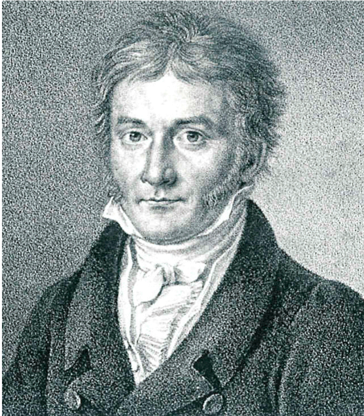
Afbeelding 3. Carl Friedrich Gauss. Lithograaf uit 'Astronomische Nachrichten'.

eeuw de opdracht om landmetingen te verrichten in het toenmalige koninkrijk van Hannover. Hij trok vele zomers te paard door het Duitse land, en kreeg naar aanleiding daarvan een revolutionair idee over kromming. Hoewel hij op dat moment al veel spectaculaire ontdekkingen in de wiskunde op zijn naam had staan, was Gauss zo trots op dit idee dat hij het in zijn notities zijn 'fantastische stelling' noemde.