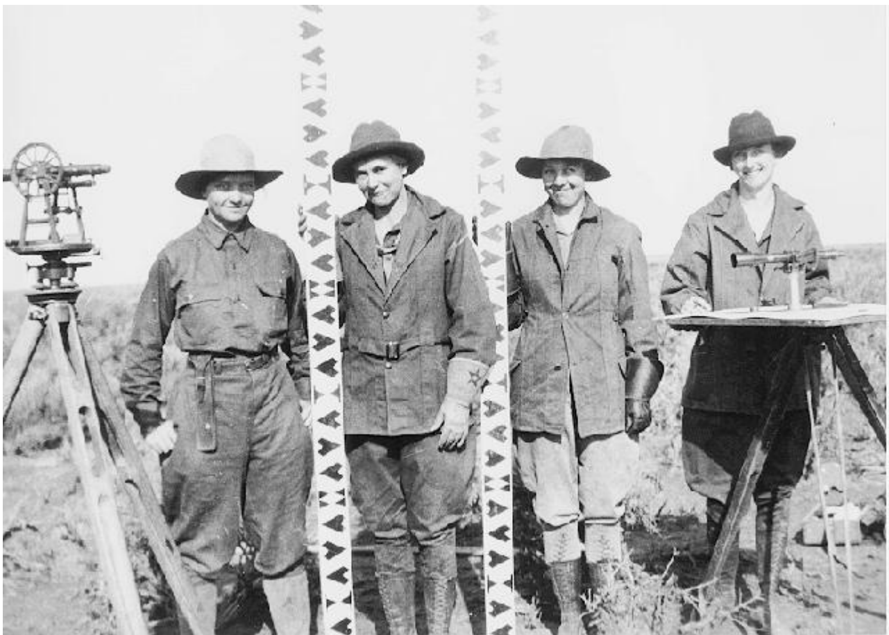
Afbeelding 2. Landmeters in Idaho, 1910.

Wat als er geen schepen in de buurt zijn, en je geen ruimteraket tot je beschikking hebt? Stel dat je op een groot, weids open weiland staat – hoe zou je dan de kromming van de aarde kunnen meten? Een mogelijk antwoord komt voort uit de landmeetkunde.