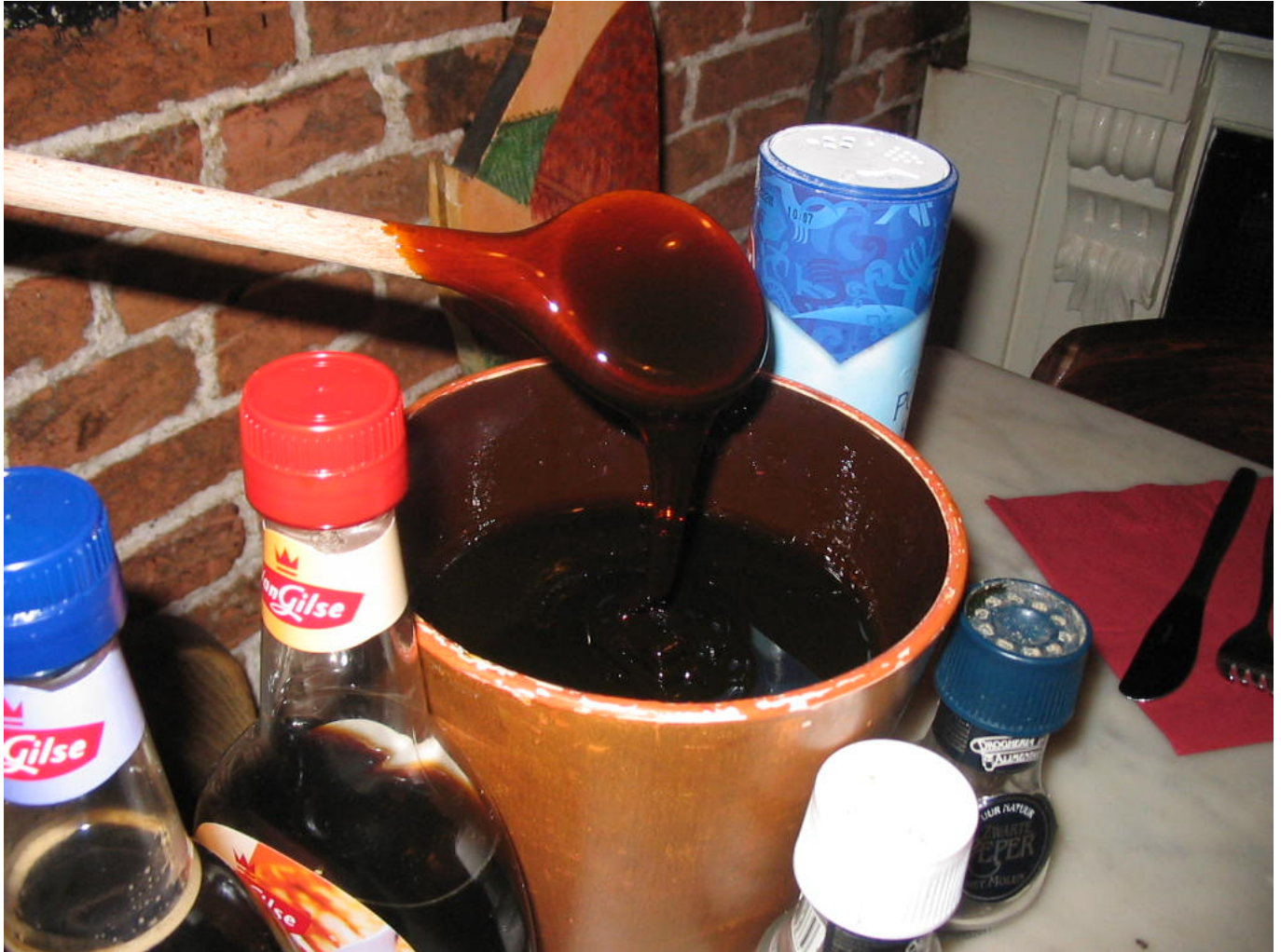
Afbeelding 2. Stroop. Door eigenschappen van de bouwstenen heeft stroop een hogere viscositeit ("stroperigheid") dan water.

Vaak is het echter lastig om uit de eigenschappen van de bouwstenen de numerieke waarden van "macroscopische" eigenschappen zoals de hierboven genoemde te bepalen.