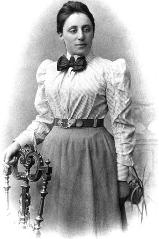
Afbeelding 3. Emmy Noether. Een andere, meer wiskundige verklaring voor het behoud van impuls is gebaseerd op de symmetrie van de natuur onder translaties, en volgt uit het werk van Emmy Noether.

Er blijkt nog een heel andere, wiskundig ingewikkeldere manier te zijn om over impulsbehoud na te denken. De natuur kent allerlei symmetrieën: operaties die we op natuurkundige systemen kunnen uitvoeren, en die ons nieuwe systemen geven die ook aan de natuurwetten voldoen. Een eenvoudig voorbeeld is verschuiving of translatie : als we een experiment een meter naar links of naar rechts verschuiven, zal het zich nog altijd volgens exact dezelfde natuurwetten gedragen.