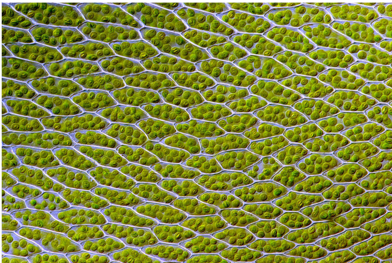
Afbeelding 1. Een blad onder de microscoop. Te zien zijn de verschillende cellen met daarin de bladgroenkorrels.