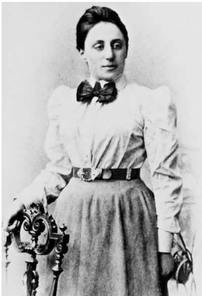
Afbeelding 3. Emmy Noether (1882-1935).

De symmetrie die bepaalt dat het heelal er op alle plekken hetzelfde uitziet, impliceert dus automatisch dat de snelheid van geïsoleerde objecten in het heelal behouden is. Als we iets preciezer zijn: niet de snelheid zelf, maar de impuls (de snelheid maal de massa) blijkt de grootte te zijn die behouden is. De relatie tussen het bestaan van behouden grootheden en de aanwezigheid van een symmetrie is volkomen algemeen, en staat binnen de natuurkunde bekend als de stelling van Noether . Het wiskundige bewijs ervoor werd in 1918 gevonden door Emmy Noether. Zij liet zien dat, als de wetten van de natuurkunde op een of andere manier symmetrisch zijn, er altijd een behouden grootte geassocieerd is met die symmetrie. Het bewijs van Noether geldt ongeacht welke natuurkundige wetten precies een symmetrie bezitten. Omdat het heelal er op alle plekken hetzelfde uitziet, weten we zeker dat er behoud van impuls moet zijn in alle mogelijke wetten van de natuurkunde die wij kennen, en zelfs in de wetten die nog ontdekt moeten worden!