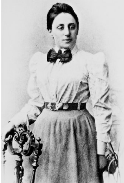
Afbeelding 3. Emmy Noether (1882-1935).

Op dezelfde manier kunnen we ook andere behoudswetten afleiden uit symmetrieën van het heelal. Het feit dat het (lege) heelal er hetzelfde uitziet ongeacht welke kant ik op kijk, betekent dat in het heelal impulsmoment een behouden grootheid is. En behoud van energie is een onvermijdbare consequentie van het feit dat de wetten van de natuurkunde op dit moment hetzelfde zijn als een jaar geleden, of een week in de toekomst.