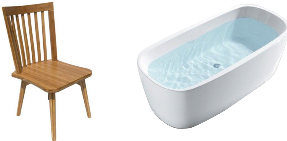
Afbeelding 6. Een stoel en een badkuip. Een stoel en een badkuip met water. Op de één kun je zitten, in de ander zink je weg.

In dat geval zal de stoel als geheel zal gaan bewegen. Dat wil zeggen: het zwaartepunt wordt verplaatst, doordat alle atomen tegelijkertijd over dezelfde afstand verplaatst worden, zonder dat daarbij de afstand tussen de atomen onderling verandert.