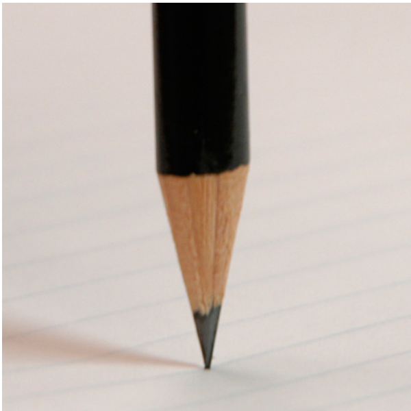
Afbeelding 5. Een potlood op zijn punt laten balanceren.

houden van een potlood. Naarmate we het potlood scherper en scherper maken, moeten we ook steeds preciezer het potlood rechtop zetten om te zorgen dat het niet omvalt. In de wiskundige limiet van een oneindig scherp potlood, is zelfs een oneindig kleine fout in het rechtop zetten voldoende om het potlood om te laten vallen. Een oneindig scherp potlood kun je dus onmogelijk op zijn punt laten balanceren, en het is alsof het potlood spontaan omvalt. De symmetrie wordt daarbij gebroken, omdat het potlood één bepaalde kant opvalt, waarna die richting er anders uitziet dan alle andere richtingen.