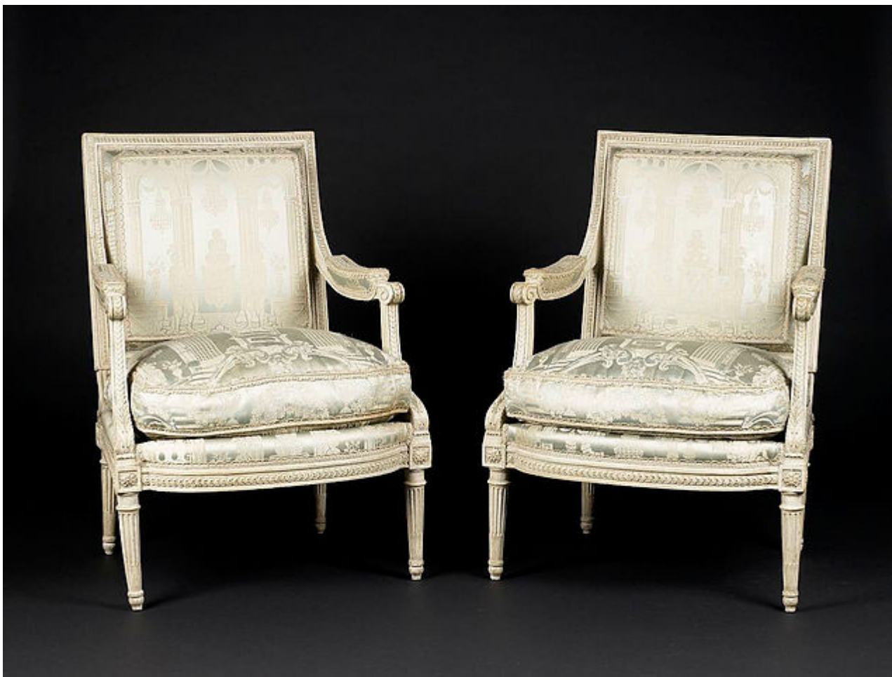
Afbeelding 1. Stoelen. Stoelen zijn gemaakt om op te zitten. Maar is het wel zo logisch dat dat kan?

Iedereen weet natuurlijk dat een stoel gemaakt is om op te zitten. Waarschijnlijk zit je zelfs op een stoel terwijl je dit leest. Maar is het eigenlijk wel zo logisch dat het mogelijk is om op een stoel te zitten?