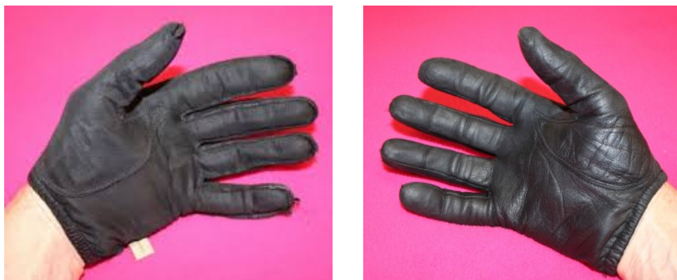
Afbeelding 2. De symmetrie van een paar handschoenen. De rechterfoto laat een rechterhandschoen aan een

In het dagelijks leven komen we regelmatig dingen met een symmetrie tegen. Hoe een fietsband eruit ziet, bijvoorbeeld, verandert niet als je het wiel draait waaraan die band zit. Bij de latex handschoenen van een dokter of tandarts ziet de rechterhandschoen er binnenstebuiten precies zo uit als de linkerhandschoen. Zelfs het menselijk lichaam is ongeveer symmetrisch, zodat je zelfs bij een foto van bekenden vaak maar moeilijk kunt zien of die via een spiegel genomen is of niet. In de natuurkunde werkt symmetrie op precies dezelfde manier. Als we een object draaien, spiegelen of binnenstebuiten keren, en het resultaat is niet te onderscheiden van het originele object, dan zeggen we dat dat object een symmetrie heeft.