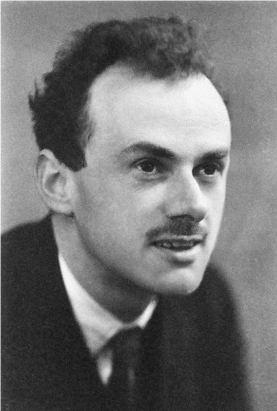
Afbeelding 3. Paul Dirac. Dirac liet zien dat één monopool genoeg is om te verklaren waarom alle elektrische ladingen in het heelal veelvoudig van een bepaalde basislading zijn.

Binnen de kosmologie zorgde de afwezigheid van magnetische monopolen in eerste instantie voor verwarring. Vlak na de oerknal waren de omstandigheden namelijk zeer geschikt voor het creëren van veel magnetische monopolen. Het feit dat wij deze deeltjes niet waarnemen zorgde dus voor een raadsel, het monopoolprobleem . De kosmoloog Alan Guth kon het uitblijven van de detectie van monopolen echter verklaren met zijn theorie van inflatie . Dit is een proces van extreme expansie van ons heelal, dat ná de creatie van de monopolen zou hebben plaatsgevonden. Deze expansie zorgde er volgens Guth en zijn collega's voor dat magnetische monopolen ver uit elkaar gedreven werden, en dat er zich daardoor maar weinig monopolen bevinden binnen het voor ons zichtbare deel van het heelal.