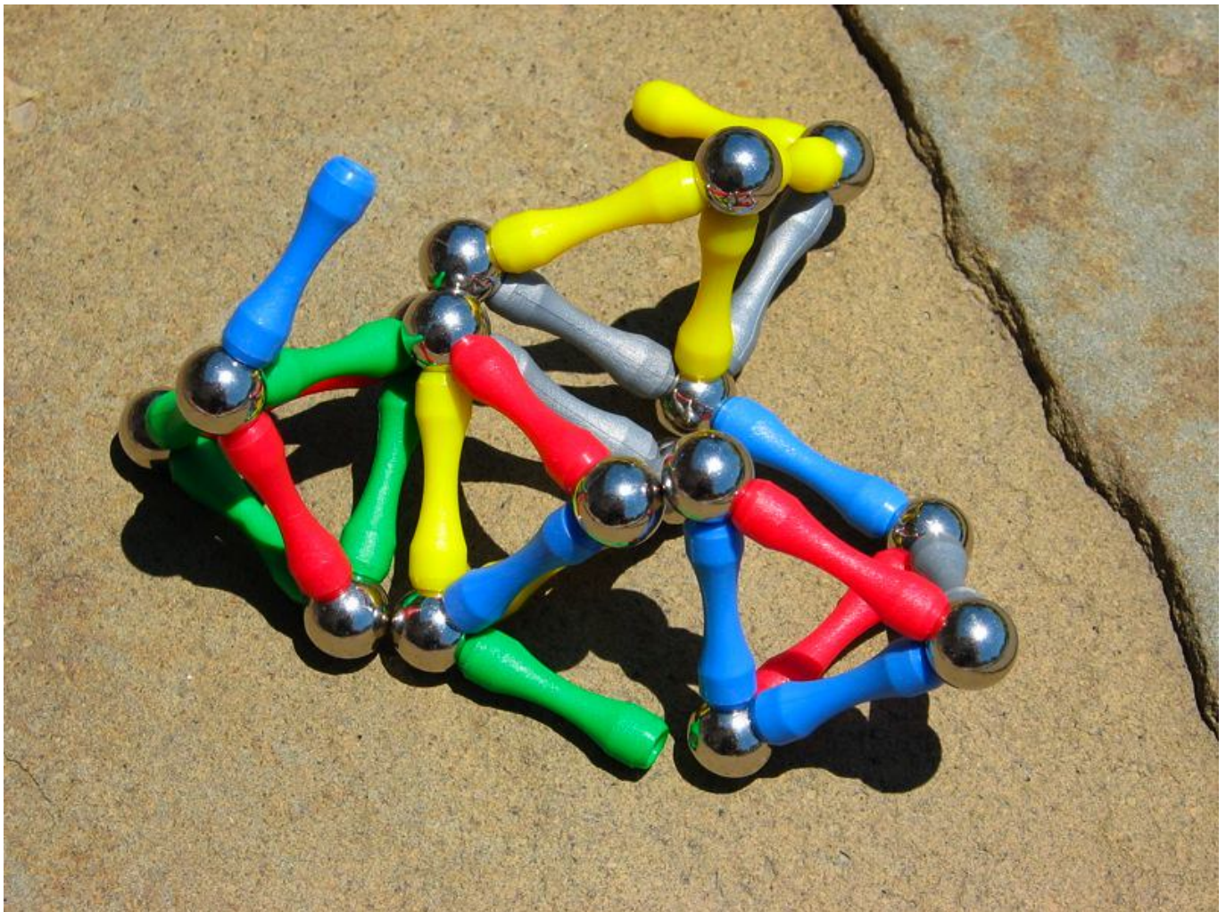
Afbeelding 1. Magneten. Magneten klikken met noord- en zuidpolen aan elkaar. Maar bestaat er ook losse noord-

Magnetische monopolen zijn nog nooit waargenomen. Toch vermoeden sommige natuurkundigen dat deze deeltjes bestaan, en vlak na de oerknal zou ons heelal er zelfs vol mee hebben gezeten. De Engelse natuurkundige Paul Dirac toonde aan dat magnetische monopolen, áls ze bestaan, zouden verklaren waarom elektrische lading gequantiseerd is. In dit artikel zullen we deze mysteries rondom dit hypothetische deeltje nader bespreken.