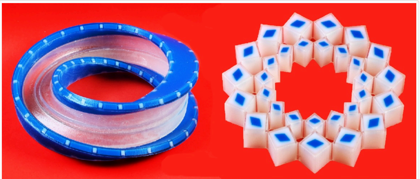
Afbeelding 1. Materialen met een geheugen. Een 3D-geprinte möbiusband (links) en oneven metaring (rechts). Dit zijn allebei niet-oriënteerbare objecten, waardoor ze altijd tenminste één punt langs de ring hebben die zich niet vervormt.

Onderzoekers hebben ontdekt hoe ze vervormbare materialen kunnen ontwerpen die altijd een punt of lijn hebben waar het materiaal niet vervormt onder druk, en die zelfs een vorm van mechanisch geheugen hebben. De resultaten zijn nuttig voor robotica en mechanische computers, en dezelfde ontwerpprincipes kunnen zelfs worden gebruikt voor quantumcomputers.