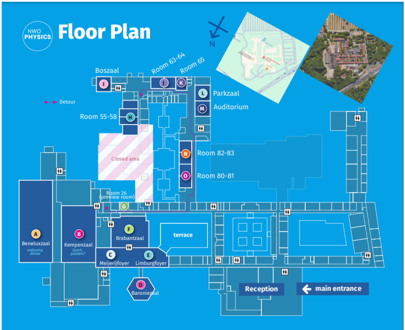
Afbeelding 1. Het doolhof. De plattegrond van het te ingewikkelde conferentiecentrum, speciaal door een van mijn collega's bewerkt om iets leesbaarder te worden.

De parallelle praatjes, samen met enkele plenaire lezingen van goede, inspirerende sprekers, maken het programma van NWO Physics interessant voor natuurkundigen uit alle richtingen en alle carrière fases, inclusief masterstudenten. Volgens sommigen is het hoogtepunt van de conferentie echter het feest, waar dit jaar onder het genot van de Boundless Vibes (het thema van de conferentie was Beyond Boundaries ) van de befaamde DJ Mike de hele avond gedanst wordt, ook door professoren!