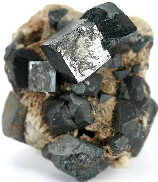
Afbeelding 1. Perovskiet. Kristallen van calcium-titanium-oxide, \text{CaTiO}_3 , een materiaal dat bekend staat als

Perovskieten vormen een familie van kristallen met veelbelovende eigenschappen voor toepassingen in de nanotechnologie. Eén nuttige eigenschap die tot nu toe echter niet in perovskieten was waargenomen, is het zogeheten effect van vermenigvuldiging van ladingdragers, dat ertoe leidt dat materialen veel efficiënter licht omzetten in elektriciteit. Nieuw onderzoek heeft nu laten zien dat bepaalde perovskieten deze gewenste eigenschap wel degelijk bezitten.