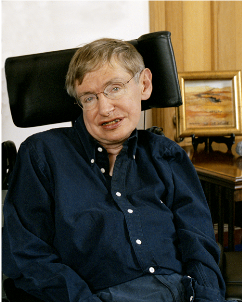
Afbeelding 1. Stephen Hawking.