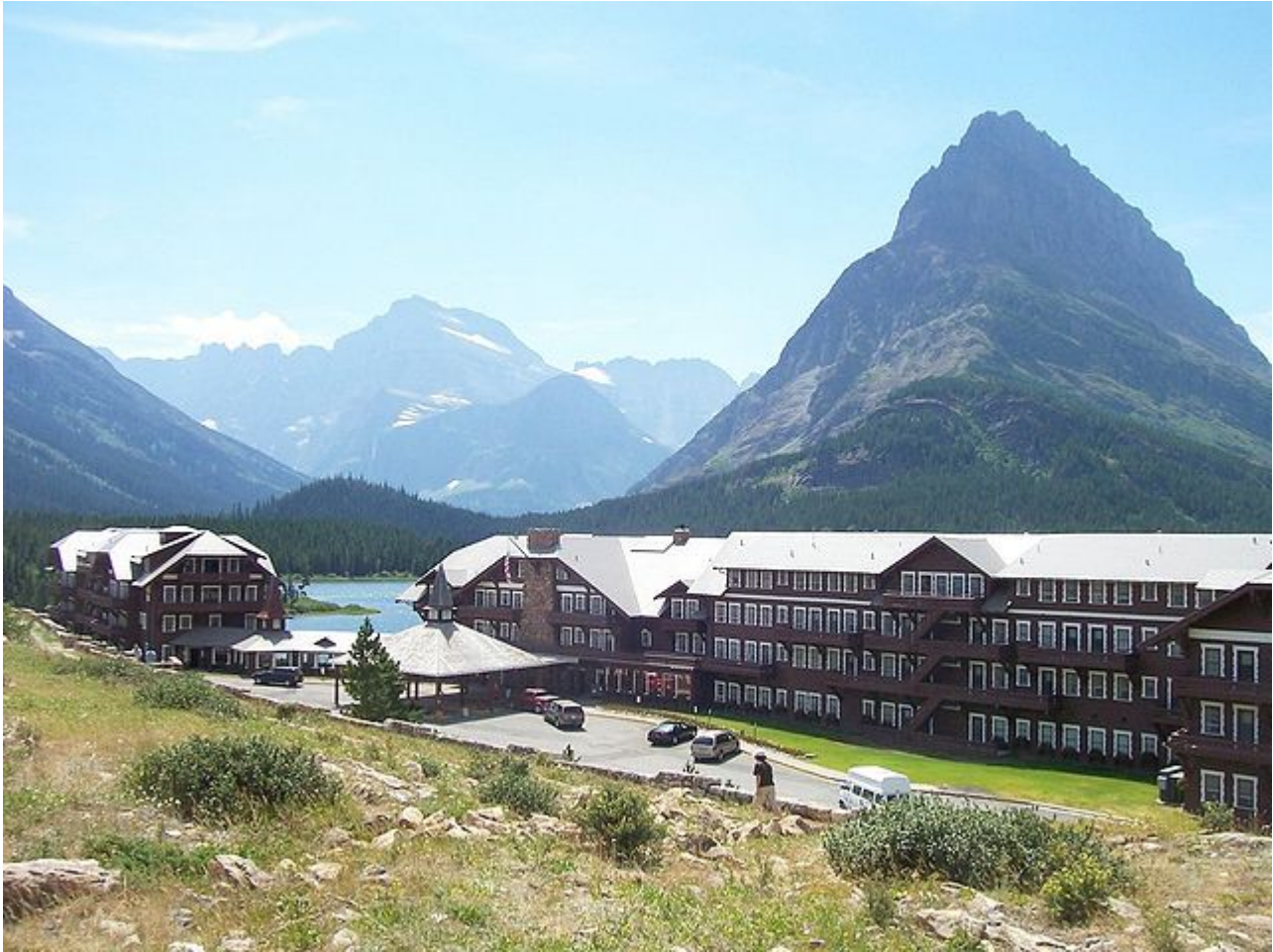
Afbeelding 4. Hilberts hotel. Hilbert gebruikte voor zijn gedachte-experiment een oneindig groot hotel. Foto: Wikipedia-gebruiker Traveler100 .

Stel dat je een hotel runt op een gewilde locatie in de bergen. Het hotel bestaat uit een balie bij de ingang, gevolgd door een lange gang met vijftig kamers aan elke zijde. Het is hoogseizoen, en alle honderd kamers zijn bezet. Elke gast die nu nog aanklopt, zul je helaas moeten teleurstellen.