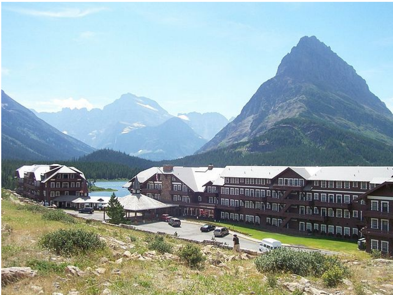
Afbeelding 4. Hilberts hotel. Hilbert gebruikte voor zijn gedachte-experiment een oneindig groot hotel.

Ook in de wiskunde zijn gedachte-experimenten een dankbaar gereedschap om moeilijk te vatten concepten helder te maken. Oneindigheid is een berucht voorbeeld van zo'n moeilijk concept, en al eeuwenlang worstelen mensen met de verwarrende situaties die eruit voorkomen. Hier kan een gedachte-experiment aan de ene kant helpen om verkeerde intuïtie bloot te leggen, en aan de andere kant zelfs bovendien tot heel nieuwe concepten leiden. Het volgende gedachte-experiment is afkomstig van de Duitse wiskundige David Hilbert.