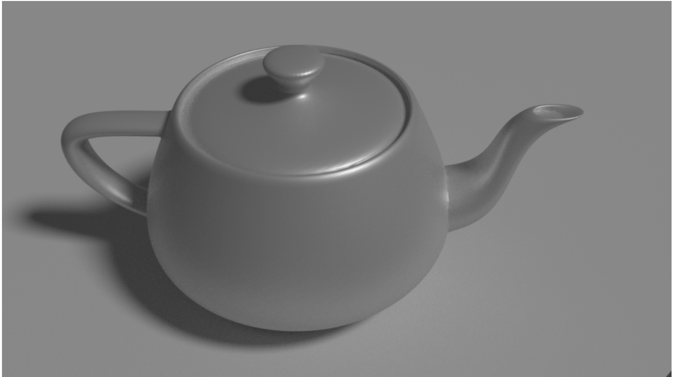
Afbeelding 4. Een 'echtere' theepot. Met behulp van raytracing wordt de theepot veel waarheidsgetrouwer. Afbeelding gemaakt door de auteur met Blender .

In principe is dit natuurkundig niet zo heel moeilijk, maar zoals zo vaak wordt dit probleem in de praktijk al heel snel erg ingewikkeld. Als je naast een theepot en een lamp ook een spiegel tevoorschijn wil toveren, zal je ook rekening moeten houden met lichtstralen die via de theepot naar de spiegel in je computercamera terecht komen. Bovendien weerkaatst de oppervlakte van een theepot niet in alle richtingen even sterk: het materiaal is vaak een beetje glanzend, waardoor de reflectie van de lamp zelf ook enigszins zichtbaar zou moeten zijn.