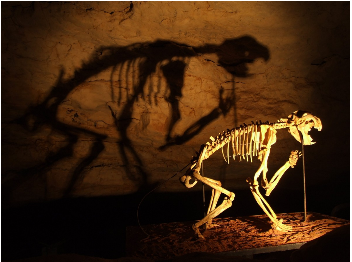
Afbeelding 1. Een schaduwspel. De oudste manier om beelden te maken is met behulp van schaduwen.