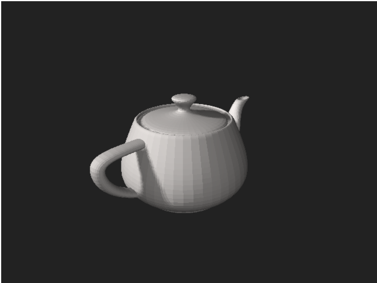
Afbeelding 3. De Utah-theepot.

Alhoewel dit model van een theepot al redelijk glad is, en de vorm er zeker overtuigend uit ziet, is dit plaatje nog heel duidelijk te onderscheiden van een foto van een echte theepot. De belangrijkste reden hiervoor ligt aan het begin van dit hele verhaal: de lichtinval.