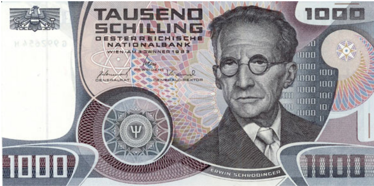
Afbeelding 5. Erwin Schrödinger. Erwin Schrödinger - en het symbool \Psi voor de golf functie - op een Oostenrijks bankbiljet van 1000 schilling.

Tenslotte zien we rechts in de vergelijking het symbool \hat{H} staan. Het hoedje op de H geeft aan dat het gaat om een zogenaamde operator : \hat{H} is geen getal, maar een voorschrift dat ons vertelt hoe we uit de \Psi op dit moment, de toekomstige \Psi kunnen uitrekenen. De notatie \hat{H} is een geval van extreme “shorthand” - in de praktijk is het namelijk zo dat deze \hat{H} er voor ieder verschillend probleem anders uit zal zien. De ene keer is het genoeg om bijvoorbeeld \Psi te kwadrateren, de andere keer moeten we ook aan de rechterkant van \Psi bepaalde afgeleiden nemen, enzovoort. Kortom: de echte fysica zit hem in de precieze vorm van de operator \hat{H} . Wat Schrödinger deed was uitvogelen hoe deze operator er voor elk fysisch systeem uitziet - dat wil zeggen: hij gaf een exact voorschrift om, als we de klassieke bewegingswetten van een systeem kennen, ook de quantumoperator \hat{H} uit te rekenen. Daarmee kon vanaf dat moment voor vrijwel elk systeem de quantum-evolutie bepaald worden. Zo konden dus voorspellingen aan quantumsystemen gedaan worden - voorspellingen die natuurlijk vervolgens weer in experimenten getest konden worden. De afleiding van de Schrödingervergelijking was dan ook een zeer belangrijke doorbraak in de ontwikkeling van de quantummechanica.