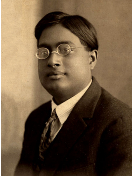
Afbeelding 1. Satyendra Nath Bose. Foto genomen in Parijs in 1925.