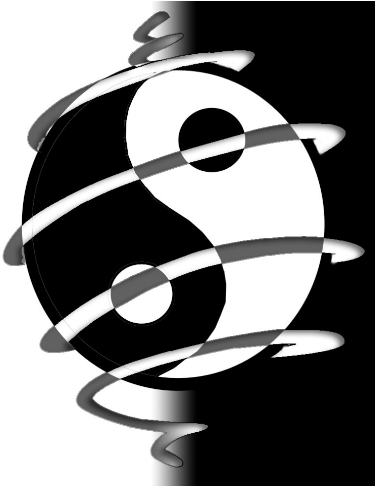
Afbeelding 1. Snaartheorie en loop quantum gravity. Yin en yang, of water en vuur?

Natuurkundigen zijn net mensen. Vraag een snaartheoreticus wat hij of zij van loop quantum gravity vindt, en het antwoord zal waarschijnlijk niet heel positief zijn. Vraag omgekeerd iemand die loop quantum gravity bestudeert of de snaartheorie een goed model is van de quantumzwaartekracht, en wederom is het antwoord waarschijnlijk negatief. Deels is dat een kwestie van trots: een voetballer die jaren voor Feyenoord heeft gespeeld, zal ook niet snel toegeven gecharmeerd te zijn van het spel van Ajax.