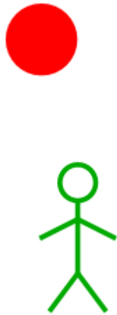
Afbeelding 2. Eenparige beweging (2). Hetzelfde experiment als in afbeelding 1, nu gezien vanuit de groene waarnemer.

De tweede waarnemer ziet in eerste instantie een van de kogels (rood) stilstaan – hij beweegt immers met dezelfde snelheid met de kogel mee. De tweede kogel (blauw) komt met dubbele snelheid op de eerste kogel af, stoot die aan, en blijft vervolgens zelf stilstaan, terwijl de eerste kogel met dubbele snelheid wegbeweegt. Wat we hier zien gebeuren is een bekend verschijnsel uit de mechanica, waarop bijvoorbeeld ook de populaire Newtonpendel (afbeelding 3) is gebaseerd.