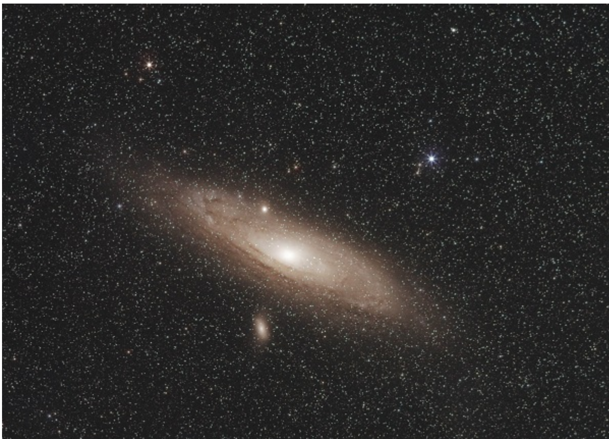
Afbeelding 3. De Andromedanevel. Het licht dat wij uit het Andromedasterrenstelsel zien komen, is twee