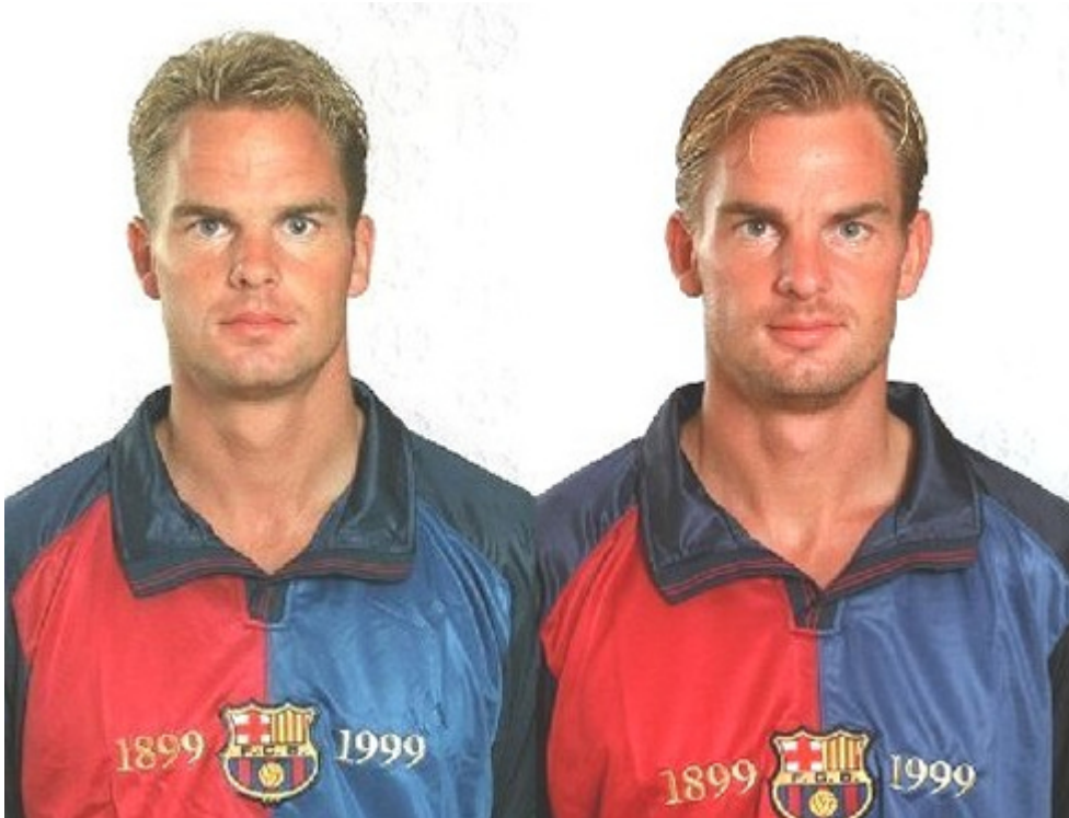
Afbeelding 1. Frank en Ronald de Boer Van een tweeling, Frank en Ronald, maakt Ronald een ruimtereis terwijl Frank op aarde achterblijft. Wie van de twee is jonger als Ronald weer thuiskomt?

Doordat Ronald met zo'n enorme snelheid reist, ziet Frank zijn klok veel langzamer lopen dan die van hemzelf. Dit geldt als Ronald van hem af reist, en nog steeds als Ronald weer (met dezelfde snelheid, alleen de andere kant op) naar hem terugreist. Frank ziet de tijd van Ronald dus op elk moment langzamer verstrijken; van Frank uit gezien zou Ronald minder oud moeten zijn geworden als hij thuiskomt dan Frank zelf op dat moment is.