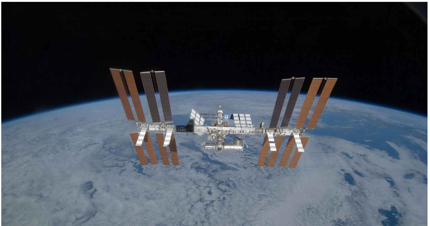
Afbeelding 1. Het International Space Station.

Dit artikel verscheen eerder in het Nederlands Tijdschrift voor Natuurkunde .