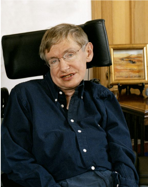
Afbeelding 3. Stephen Hawking. Hawking ontdekte in 1974 dat zwarte gaten op het quantumniveau heel langzaam straling kunnen uitstralen, en stelde in 1975 dat dit leidt tot de beroemde informatieparadox.

Een tweede mogelijkheid is dat de oorspronkelijke berekening van Hawking niet helemaal volledig was. In die berekening worden inderdaad enkele aannames en vereenvoudigingen gemaakt, en het zou kunnen dat daarmee in zekere zin het kind met het badwater wordt weggegooid. Wellicht blijkt bij een nog preciezere berekening dus dat de Hawkingstraling wel degelijk een klein beetje informatie bevat, en dat uit de informatie van alle straling bij elkaar uiteindelijk toch de hele ontstaansgeschiedenis van een zwart gat gereconstrueerd kan worden.