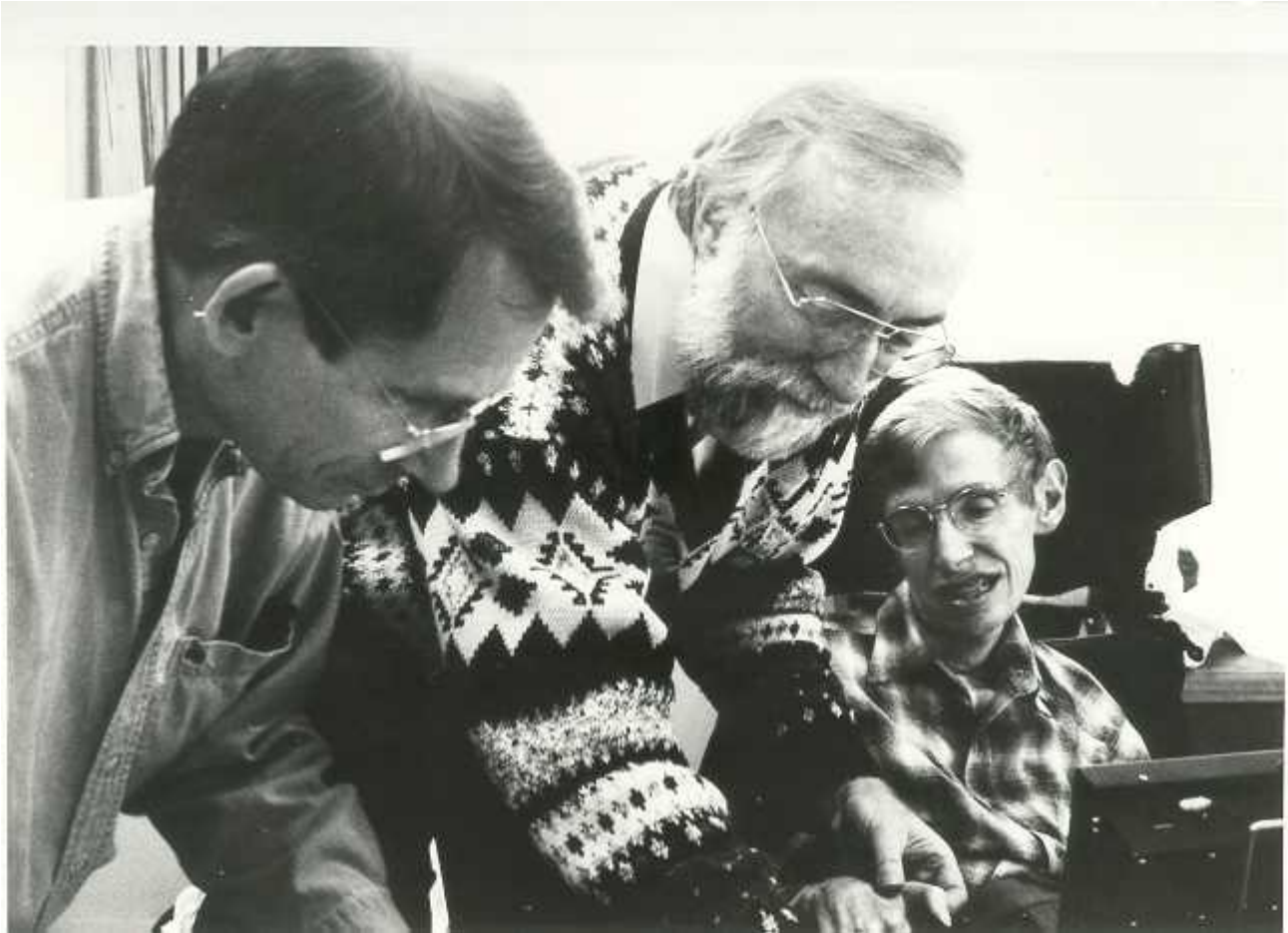
Afbeelding 4. John Preskill, Kip Thorne en Stephen Hawking. Hawking, Preskill en Thorne sloten in 1997 een beroemde weddenschap af over de informatieparadox.

De weddenschap werd zoals gezegd in 1997 afgesloten, nadat er al ruim 20 jaar weinig voortgang was geboekt in het oplossen van de paradox. De tijd was echter rijp voor een oplossing: aan het eind van datzelfde jaar schreef Juan Maldacena een eerste versie van zijn artikel over de AdS/CFT-correspondentie. Uiteindelijk zou dat artikel ertoe leiden dat één van de partijen de weddenschap zou opgeven.