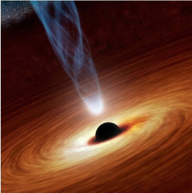
Afbeelding 3. Een zwart gat. In ons heelal is het centrum van een zwart gat (de singulariteit) een nuldimensionale punt. In snaartheorieën kunnen echter ook zwarte gaten voorkomen die zich langs meerdere dimensies uitstrekken.

Dat laatste bleek inderdaad het geval: de snaartheorie reproduceert de relativiteitstheorie van Einstein (en vult die theorie verder aan), en de vergelijkingen van de theorie hebben dus inderdaad oplossingen die zwarte gaten beschrijven. Doordat snaartheorie in meer dan drie ruimtedimensies geformuleerd is, blijkt er echter nog veel meer mogelijk. Naast bolvormige zwarte gaten waarvan het centrum (de singulariteit ) een punt is, is het in de snaartheorie ook mogelijk om hogerdimensionale zwarte gaten te construeren waarvan het centrum een één-dimensionale lijn, een tweedimensionaal membraan, of een hogerdimensionale vorm is. Deze 'zwarte objecten' kregen al snel de naam p-branen , waarin de 'p' staat voor een getal van 0 t/m 9 dat de dimensie van de singulariteit in het object aangeeft. (Een 0-braan is dus een gewoon zwart gat, een 1-braan een 'zwarte snaar', enzovoort.)