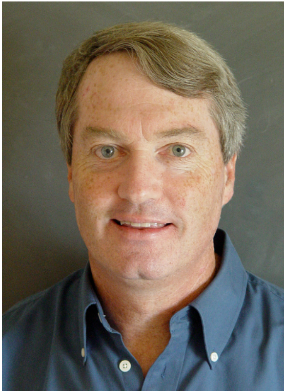
Afbeelding 4. Joseph Polchinski. Polchinski ontdekte in 1989 samen met zijn collega's D-branes, en bewees in 1995 dat D-branes en zwarte p-branes exact dezelfde objecten waren.

gesloten snaren ) de objecten ziet. In het bijzonder is het zo dat ook op het aantal dimensies van zwarte p-branen allerlei restricties blijken te zijn; die restricties komen exact overeen met de restricties op D-branen.