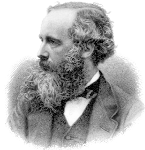
Afbeelding 2. James Clerk Maxwell (1831-1879). Maxwell toonde aan dat elektriciteit en magnetisme verschijningsvormen van dezelfde kracht zijn.