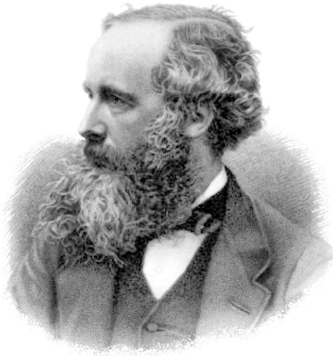
Afbeelding 2. James Clerk Maxwell (1831-1879). Maxwell toonde aan dat elektriciteit en magnetisme verschijningsvormen van dezelfde kracht zijn.