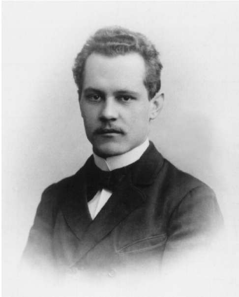
Afbeelding 3. Arnold Sommerfeld (1868-1951). Sommerfeld voerde de fijnstructuurconstante in als maat voor de sterkte van de elektromagnetische kracht.