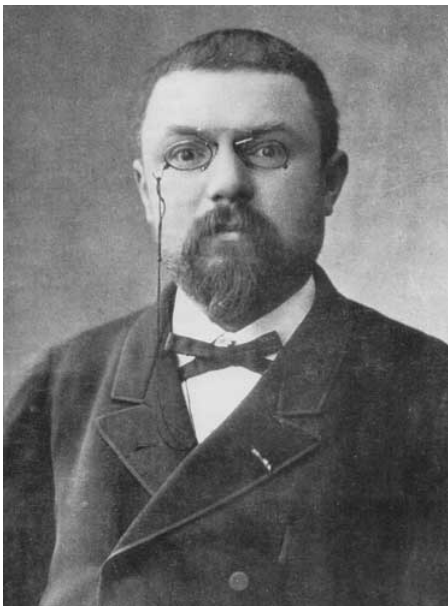
Afbeelding 3. Henri Poincaré (1854-1912). Poincaré was de eerste wiskundige die asymptotische reeksen in detail bestudeerde.

Een heel eenvoudige strategie zou de volgende kunnen zijn. We nemen een reeks zoals de reeksen hierboven, vullen de gewenste waarde van x in, en tellen de termen op zolang ze kleiner blijven worden . Zodra er echter een term groter wordt dan de voorgaande, kappen we de berekening af, en beschouwen we de optelsom die we dan gevonden hebben als het eindantwoord van de berekening. In de twee voorbeelden hierboven zouden we voor x=0,2 dus alleen de eerste vijf termen optellen, en voor x = 0,1 alleen de eerste tien. Deze 'genoeg is genoeg'-procedure wordt optimale truncatie genoemd.