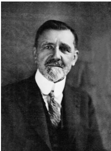
Afbeelding 2. Émile Borel (1871-1956).

De noemers van de breuken zijn opeenvolgende machten van 10; de tellers zijn 1, 2 \times 1, 3 \times 2 \times 1, 4 \times 3 \times 2 \times 1 , enzovoort. Deze getallen worden 'faculiteiten' genoemd, en met behulp van een uitroepteken geschreven als 1!, 2!, 3!, 4! , enzovoort.